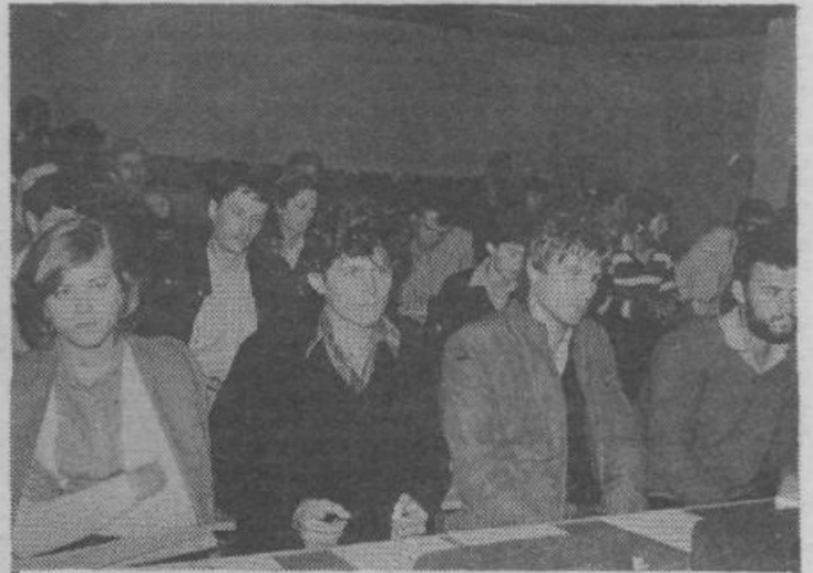
Število osnovnih organizacij ZSMS se je povečalo — so ugotovili mladi na svoji zadnji seji občinske konference

V TEJ ŠTEVILKI NAŠE SKUPNOSTI TUDI UMETNIŠKA PRILOGA 25. MAJ!