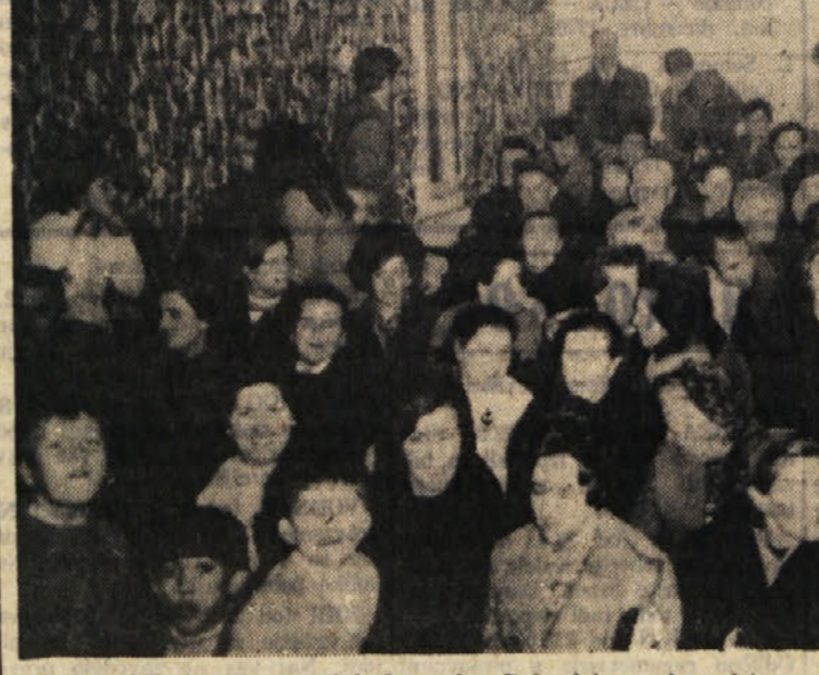
Del občinstva v prosvetni dvorani v Doberdolu med predstavo prosvetnih delavcev iz Trbovelj

Po uradnem delu, ki se je zaključilo s predstavo, je sledilo sproščeno družabno srečanje in pri tem seveda ni manjkalo naših lepih nesmi. Pred razhodom je zadonela še Prešernova «Zdravica», nakar so gostje iz Trbovelj odšli v Križ pri Trstu, kjer so ponovili svoj nastop.