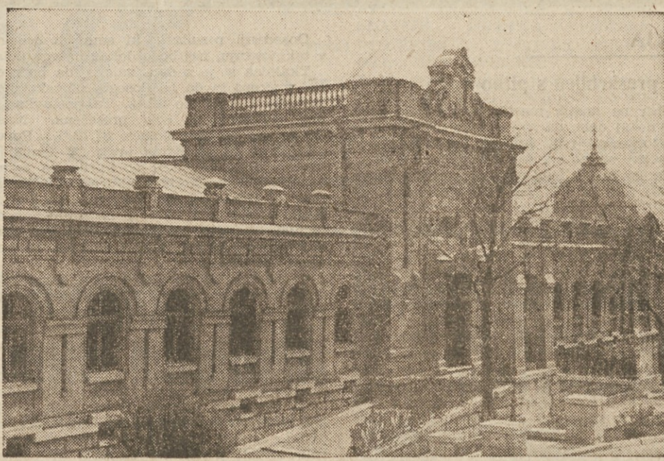
Pred otvoritvijo zdraviliške sezone v Pjatigorsku. Poslopje Puškinovih žveplenih toplih