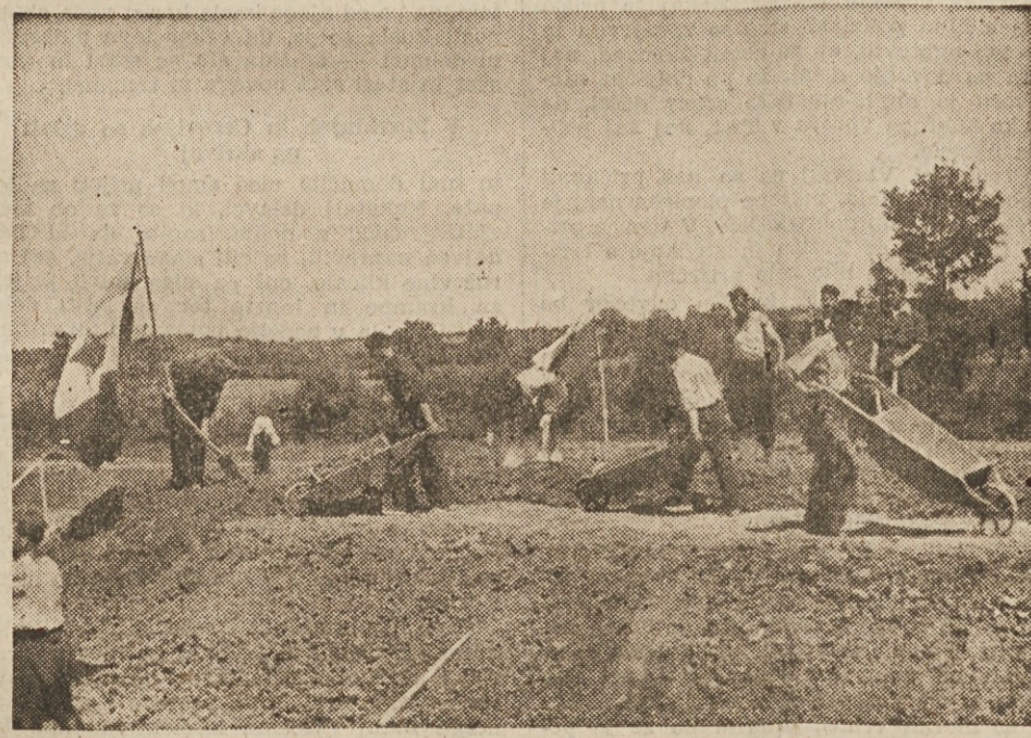
Mladinska brigada »Janko Premr« iz Juljske Krajine na delu v Bjeloi — vzdolž nove proge