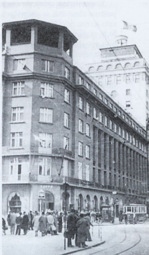
Italijanska zastava na Nebotičniku v času italijanske okupacije, 15. maj 1941

Videl sem veliko delavcev, kako so pili. Denarja navadno že v ponedeljek niso imeli več. Prosili so za »foršus« ali kakega resnega sodelavca.