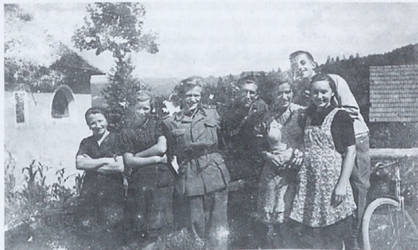
Vaški zaupni prijatelji

Sklenil je, da bo še posebno previden v svojih mislih in besedah, vedel je, da sleherna misel v besedi zapušča globoko sled v človekovi, zlasti mladi duši.