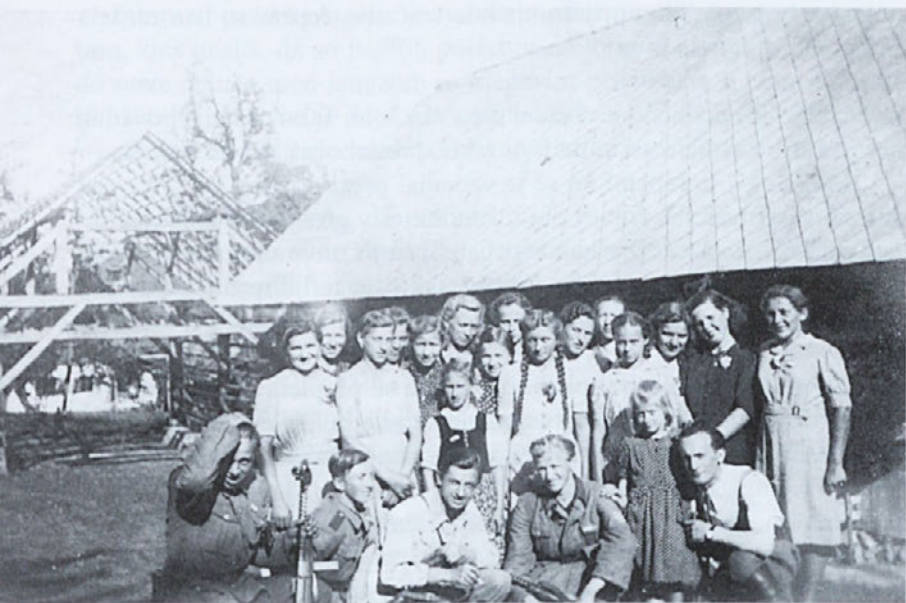
Vaška dekleta s prijatelji

Bil je v letih, ko zdrava mlada duša išče nekaj, kar ne najde doma, niti mu tega ne more dati prijatelj, nekaj, kar je več kot prijateljstvo. Poleg vseh dejavnosti in družbe, ki jo je imel se je včasih počutil samega.