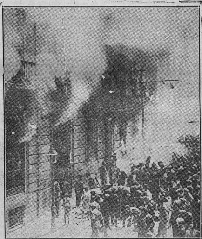
Prizor iz zadnjih izgrediv v Madridu: Množica gospoduje na ulici. — Podobne slike nudijo sedaj mnoga španska mesta...

Sodna oblast je s temi strogimi obsodbami podala dokaz, da ne sme nihče nezakazvano izrabljati, pod krinko resnega bančnega zavoda, zaupanja javnosti, ki zavodu zaupa svoje velike in male denarje.