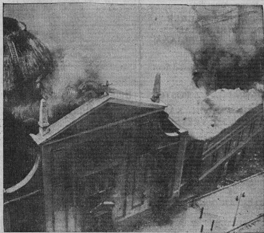
Slika, ki se v Španiji že mnogo krat ponavlja: debeli oblaki dima se valijo iz zažga njih poslopij

V Maroku je prevzel vodstvo upora general Franco, na Španskem pa je eden izmed glavnih voditeljev revolucije general Mola, ki baje koraka proti Madridu in kateremu hiti na pomoč, z večjimi oddelki svojih pristašev, tudi vodja španskih fašistov Primo de Rivera, ki so ga uporniki rešili v Alicanteju iz ječe, v kateri je sedel.