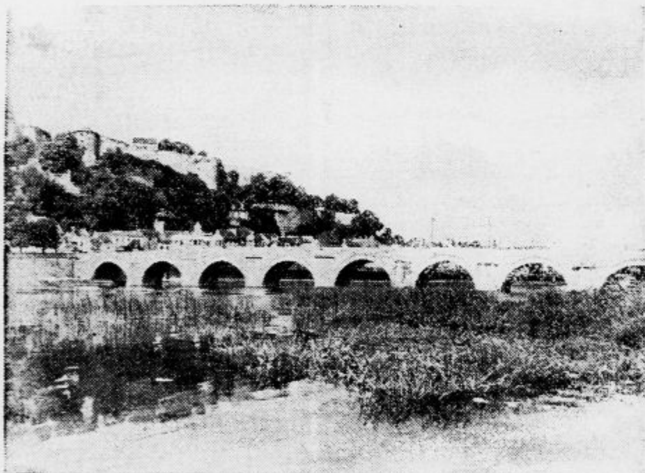
pri Namurju v Belgiji