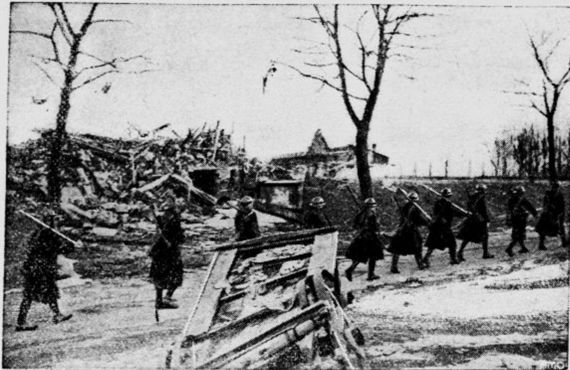
Oddelek vojaštva koraka v vas, ki jo je sovražnik porušil do tal