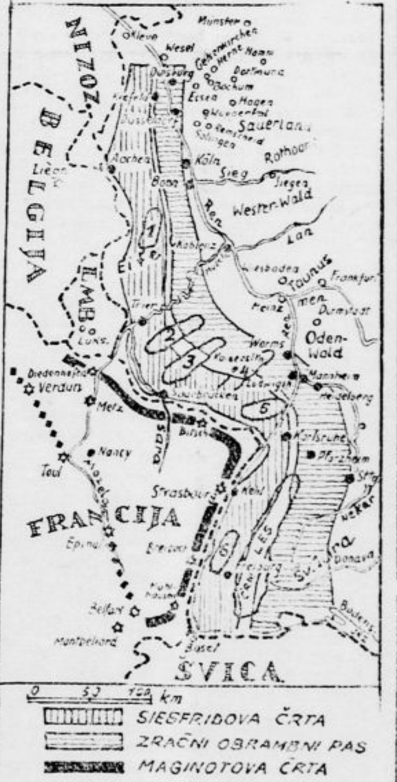
Pričujoča zemljevid z narisom Siegfriedove črte in Maginotove linije nazorno tolmačita sedanjí položaj na tem odseku zapadnega bojišča