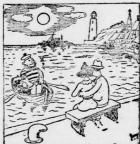
Ob nabrežju »Morda želi gospoda napraviti majhen izlet proti minskemu polju?« (»Il Travaso«)