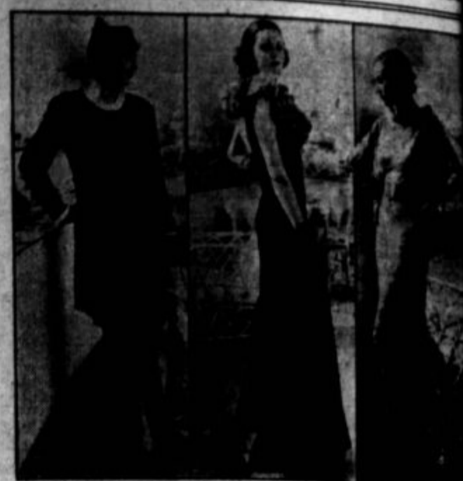
Čikaška razstava: Jesenska moda, ki jo razkazujejo v kazini Blue Ribbon.