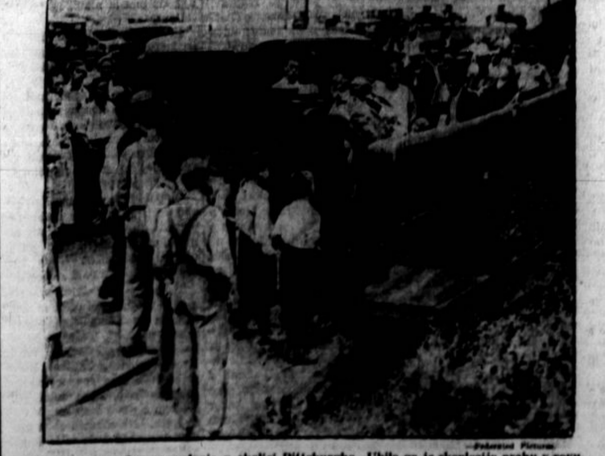
Pogreb ponesrečenega rudarja v okolici Pittsburgha. Ubila ga je eksplozivna prahu v rovu.

Huntington, Ind. — Mestna vlada je sklenila, da bodočem letu ne bo pobirala davkov, ker bo krila izdatke za svojo admi- nistracijo vključevati šole in do- bička mestne elektrarne in vodo- voda. Mestece je majhno, šteje je okrog 3500 prebivalcev, ki pa so toliko "krajti," da lahko žive brez elektrarskega trusta.