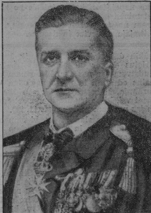
Vladar Madžarske — admiral Nikolaj pl. Horthy — je slavil dne 16. novembra 15letnico, odkar je pregnal iz Ogrske komuniste ter prevzel krmilo države. (zvezo), ki bi ne smel biti samo na pa-

Dr. Hodža je tudi naglasil, da bi se morala delati agrarna politika v širšem okviru: agrarne (poljedelske) države bi morale med seboj skleniti blok