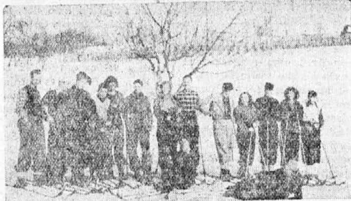
Smučarski tečaj Sok. društva Čakovac (Međumurje)