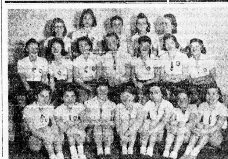
Учеснице течаја за најбоље вежбанице, у Београду

Молећи Ваш архијерејски благослов, молимо Вас да примите, уз изразе благодарности и дивљења целокупног југословенског соколства, и наш соколски поздрав: ЗДРАВУ!