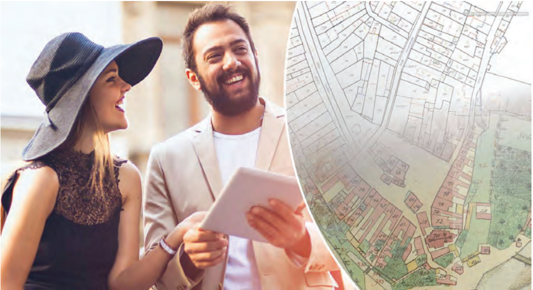
Slika 1: Z naslovnice informativne spletne strani http://www.kataster200.at/ .