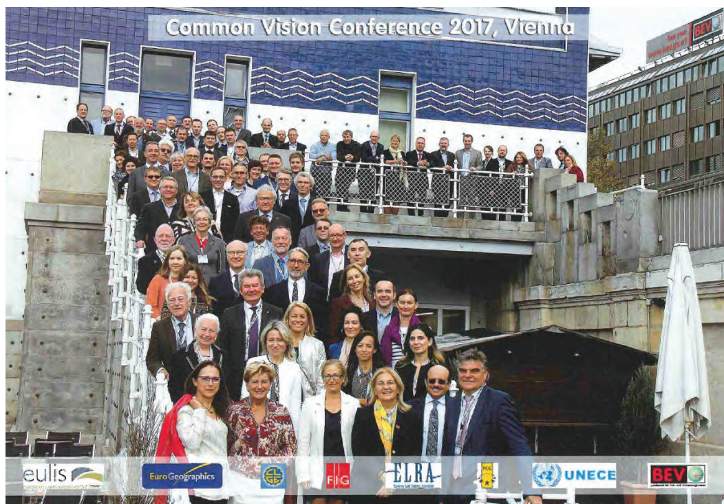
Slika 2: Udeleženci mednarodne konference o viziji razvoja katastra nepremičnin Common vision.