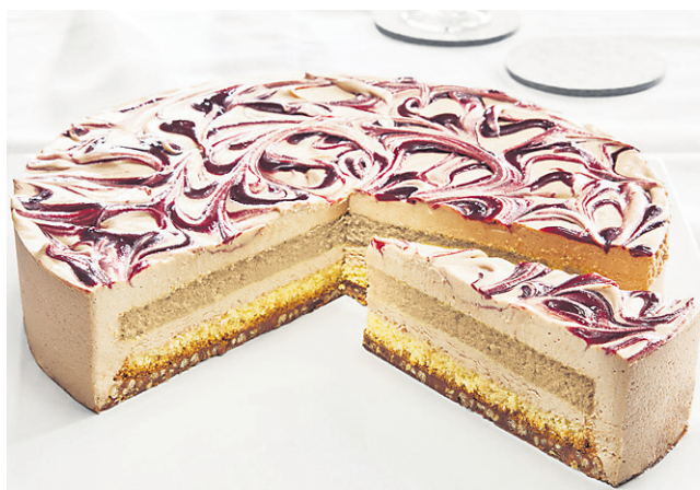
Lešnikova smetanova torta

Zmlete lešnike pa lahko predelamo tudi v lešnikov namaz, jih damo kot osnovno sestavino pri lešnikovih rogljičkih ali so dodatek za lešnikov sladolead in zmrzlino. Preden jih uporabimo, jim moramo odstraniti rahlo grenko zunanjo kožico, ki jo odstranimo le s praženjem. Ko zunanja koža porjavi, jih zavijemo v krpo in krpo močno drgnemo, da se odluči grenka zunanja lupina. S pra-