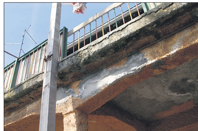
Težave imajo tudi zaradi propadajočega skupinskega balkona, ki je dolg vsaj 12 m in je na več mestih razpokan, ponekod pa tudi brez ograje.