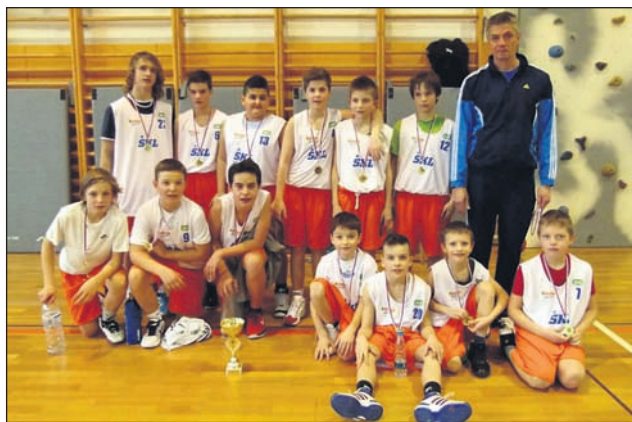
Ekipa OŠ Olge Meglič