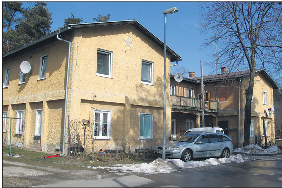
Tako žalosten je pogled na poslopje nekdanjega štaba taborišča Šterntal, v katerem danes živi 21 stanovalcev, saj so prenovili le polovico propadajoče zgradbe.

„Tudi na ta nevaren balkon, ki si ne zasluži tega imena, smo večkrat obvestili odgovorne na Občini Kidričevo, vendar ostaja vse pri obljubah, češ da trenutno za to ni dovolj denarja, da bodo zadeve že uredili. Kaj pa če se komu kaj zgodi, pogledjte, ves je razpokan, omet od-