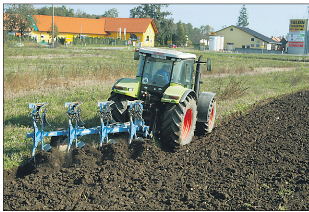
Vozniki traktorjev so pred vključitvijo na prometno cesto dolžni s koles očistiti večje kose zemlje in blata.

na cesto navozijo zemljo, blato ali gnoj. Ker je v zgodnjih spomladanskih mesecih vlažnost zraka visoka, navožen material cesto hitro naredi spolzko in nevarno za druge udeležence v prometu. Zgodi se, da zaradi neodgovornosti posameznika postane udeleženec prometne nesreče drugi voznik, povzročitelj, ki so cesto onesnažili, pa so občinski redarji zelo pogosto ugotovili po sledovih umazanih gum, ki so vodili od polja po cesti do domačije.