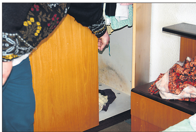
Ker je 80 let stara fasada brez izolacije, so stanovanja polna vlage in plesni, tako da propada tudi pohištvo.