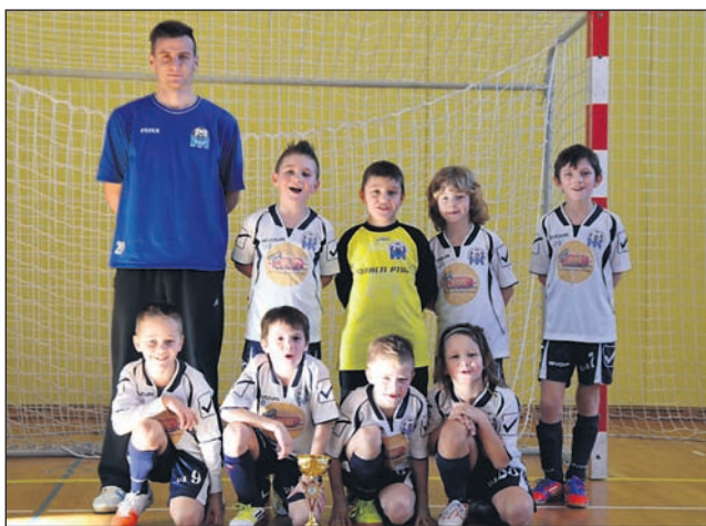
Ekipa NŠ Poli Drava je zmagala na turnirju v Račah.