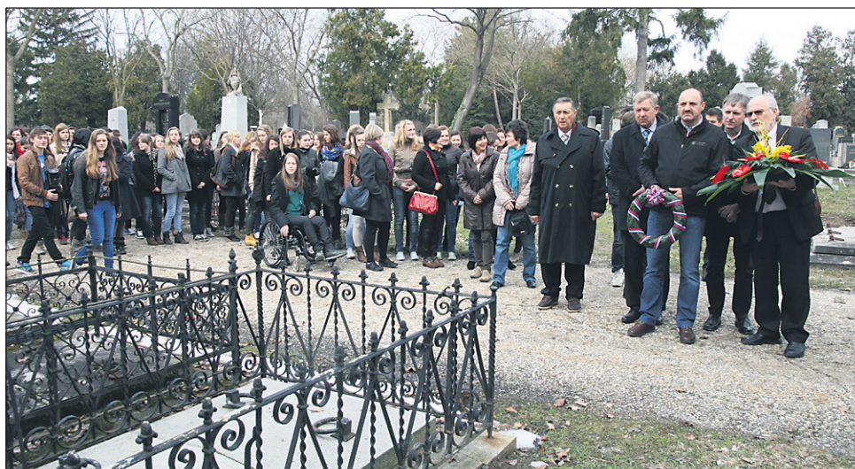
Ljutomerska delegacija ob grobu Franca Miklošiča

Franč Miklošič je bil rojen v Radomerščaku pri Ljutomeru, Prlekijo pa je zapustil po osnovni šoli. Izobraževalno pot je nadaljeval v Varaždinu, Mariboru, Gradcu in na Dunaju, kjer se je ustalil. Leta 1838 je doktoriral iz filozofije na graški univerzi, dve leti pozneje pa si je doktorski naziv pridobil še iz prava na dunajski univerzi. Zaposlen