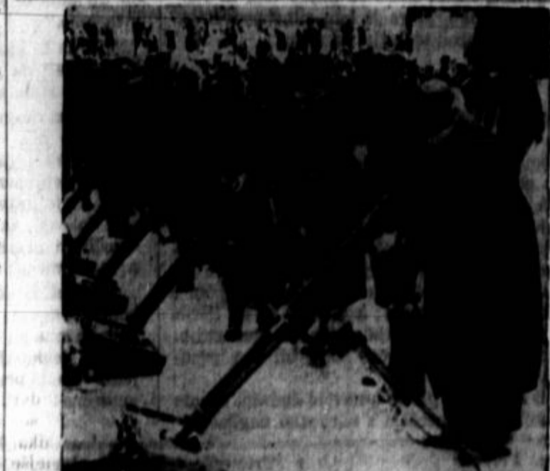
Italijanske vojne vdove, katerih moške so padli v Abesiniji, kinčajo fašistično orožje.

Umetniška K Bodanzkemu, slavnemu dirigentu newyorške opere Metropolitan, je prišel nekoč "kralj jazz" Paul Whiteman in dejal: "Spoštovani mojster, plačam vam 25.000 dolarjev, ako me naučite 'klasičnega diriganja'!" "Koliko zaslužite na leto, mister Whiteman?" je vprašal Bodanzky.