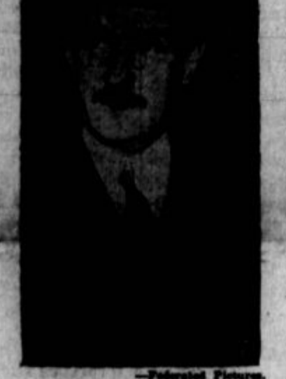
—Poljski Premier. Camille Chautemps, novi francoski premier.