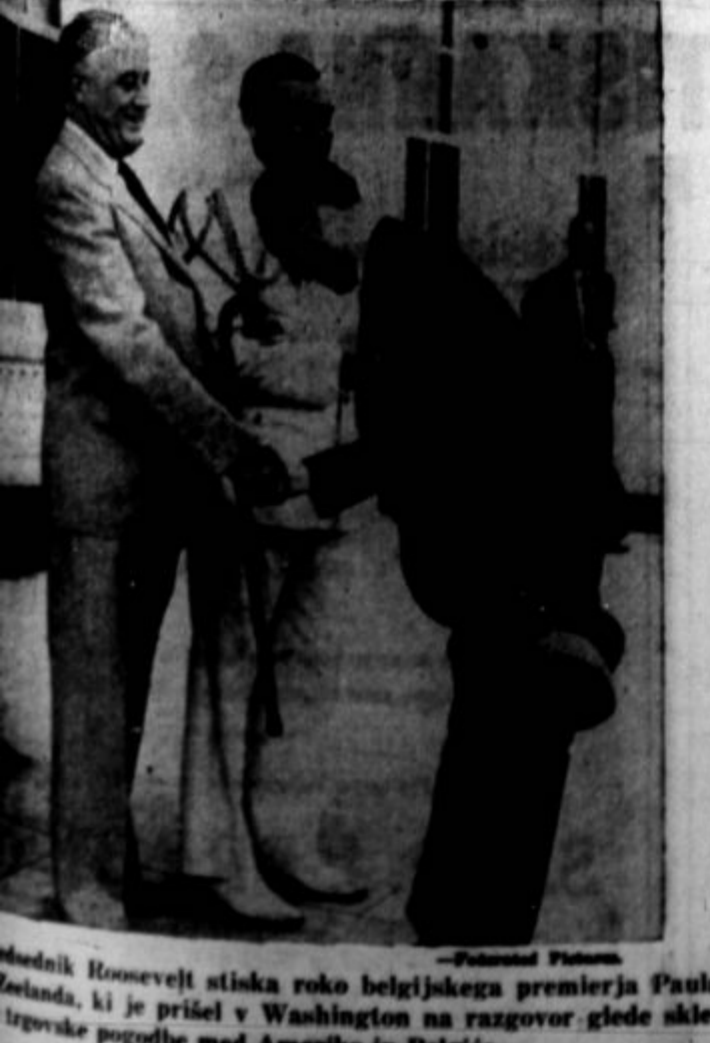
predsednik Roosevelt stiska roko belgijskega premierja Paula Lacombea, ki je prišel v Washington na razgovor glede skleptovske pogodbe med Ameriko in Belgijo.