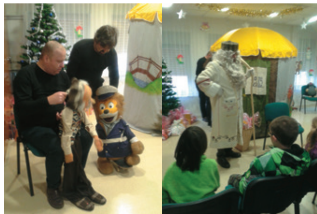
Policist je v lutkovni predstavi pomagal dedku in mu vrnil igrače, ki mu jih je ukradel hudobni mož

V soboto, 12. decembra, so otroci prišli v Dom obrtnikov na lutkovno predstavo, v kateri je hudobni mož poskušal ukrasti darila, ki sta jih po naročilu Dedka Mraza čuvala Dedek in Krtek. Policist je poskrbel, da so bila vsa darila vrnjena, zato je Dedek Mraz lahko obdaril sto otrok. Dobri mož je v darilne vrečke položil igrače, družabne igre, pripomočke za ustvarjanje, sladkarije in še kaj, s čimer se bodo otroci lahko kratkočasili in zabavali v dolgih zimski večerih.