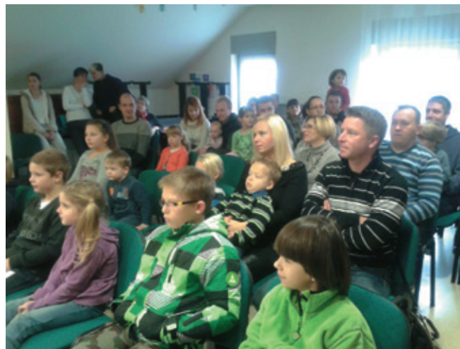
Dvorana je bila polna otrok in staršev