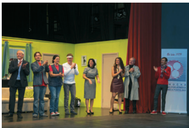
Za smeh so po podelitvi priznanj poskrbeli člani Amaterskega gledališča DPD Svoboda iz Loške doline.