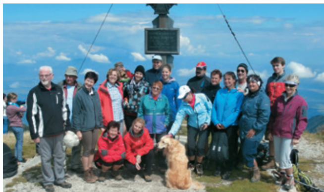
Obrtniški zbor »Notranjska« na Ojstrcu vrh Obirja, 22. avgusta 2015