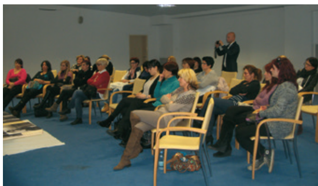
Udeleženke frizerskega seminarja