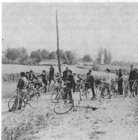
Planinski izlet s kolesi, v ozadju Zovnek in še del parkovnega nasada, 24. 6. 1981

Za spremembo sva šla do izhodišča z avtom, saj je ob glavni cesti Celje–Ljubljana, pri Pihlebertovem mostu čez Bolsko. Na križišču je čudovita rogovila s kažipoti (danes je nova), toda Grmade na teh kažipotih nisva našla. Prav nama je prišel opis, pa tudi karti. Nekako je šlo do gozda, tudi v njem sva se znašla, hodila sva levo in desno, toda »očesca« (markacij) nisva našla nikjer! Srečala sva priletno domačinko, ki je nabirala gobe, pa o tem ni vedela nič povedati. Prišla sva do enkratne točke, cerkve sv. Martina. (Je iz l. 1545, nekdanj božjepotna. Tod mimo so se vile procesije »za dež« in še naprej k dobroveljskim cerkvam.) Do Prekope je od tu slaba dva km še navadne ceste. S kolesom se da peljati, toda tudi tu ni markacij. Od cerkve drži dobra vozna pot po dolini Trbolce do lovskega doma! V pol ure sva bila na cilju! Edini markaciji sta tu, ne pa na Grmadi!