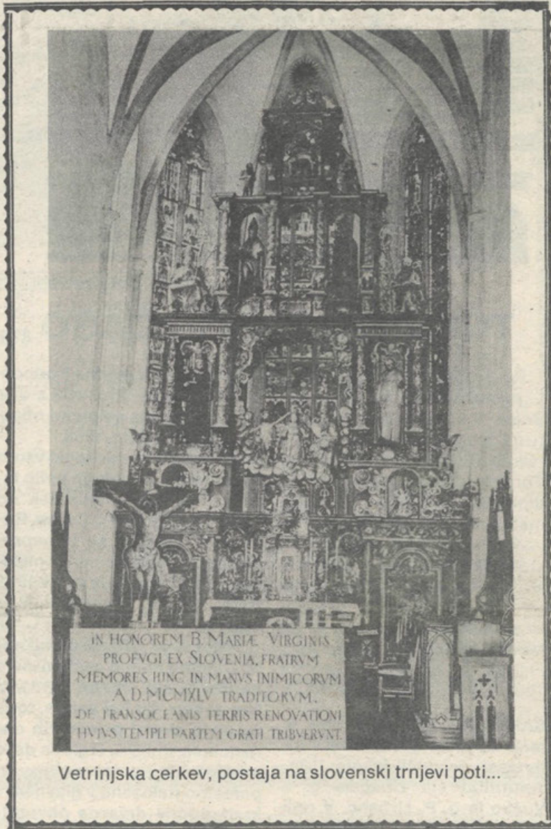
Vetrinjska cerkev, postaja na slovenski trnjevi poti...