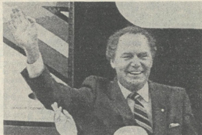
Bivši kanadski generalni guverner, predstavnik kraljice, se poslavlja.

„Iz različnega govorjenja in pisanja je mogoče razbrati, da