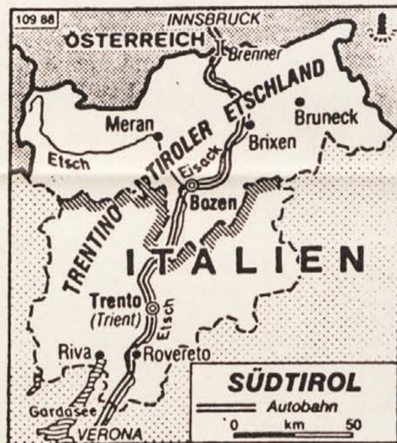
Južni Tirol, deželna glavarja Partl in Durnwalder