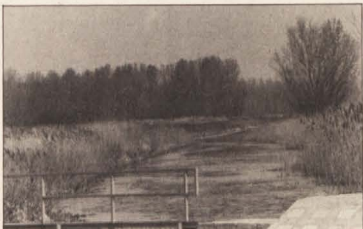
Blatno jezero je cilj letošnjega hita Slovenskega vestnika

tridnevno potovanje (avtobusni prevoz, 2 polpenziona, dodatna večerja v tipični madžarski čardi s cigansko glasbo, dve nočitvi v hotelu srednje kategorije ob Blatnem jezeru ter enodnevni izlet v Budimpešto) stane samo 1400 šilingov po osebi! Cena velja za dvoposteljno sobo, za enoposteljno sobo pa je treba doplačati 240 šilingov. Prijavite se čimprej na uredništvo Slovenskega vestnika na telefonsko številko (0463) 51-43-00 (Milka Kokot, Tatjana Marko).