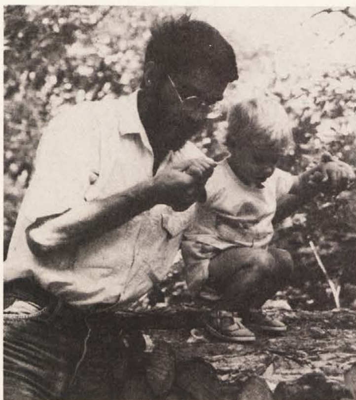
Vedno več staršev je prisiljenih, da svoje otroke vzgajajo sami

Tiste pa, ki od študije pričakujejo več podatkov o situaciji tako imenovanih „mami-otrok-družin“, pa bodo razočarane, ker se štu-