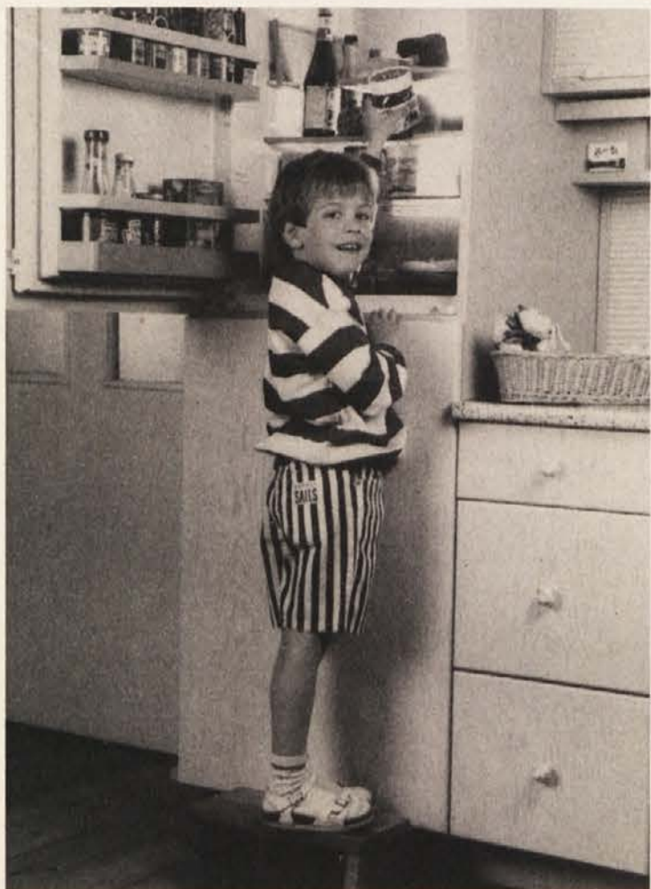
Pri kuhanju še posebej pazite na higieno!

V preteklih tednih so se širile vesti, da je tako imenovane salmonelle (ki povzročajo težka obolenja prebavnih organov in v nekaterih primerih tudi smrt) najti v perutnini in surovih jajcih. Sicer je res, da še zdaleč niso okužena vsa jajca, tudi ne vsa perutnina, vendar pa so se salmonelle v zadnjih letih tudi pri nas tako razširile, da bo pri pripravi jedi treba več pozornosti. Lani je za to infekcijo v Avstriji umrlo deset oseb, zbolelo pa jih je kar 8.500. Nekateri strokovnjaki pa ocenjujejo, da je število obolenj celo desetkrat višje!