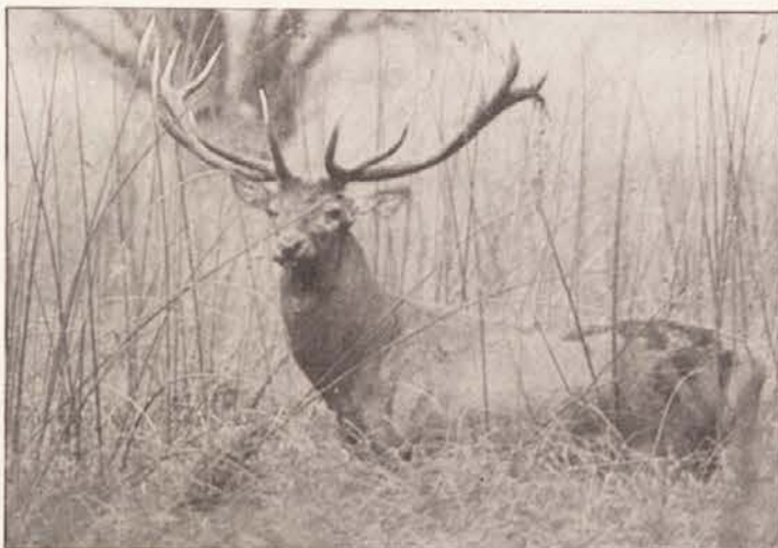
Ali je divjačina okužila vodo?

Trenutno pa prebivalcem tega območja ne preostane