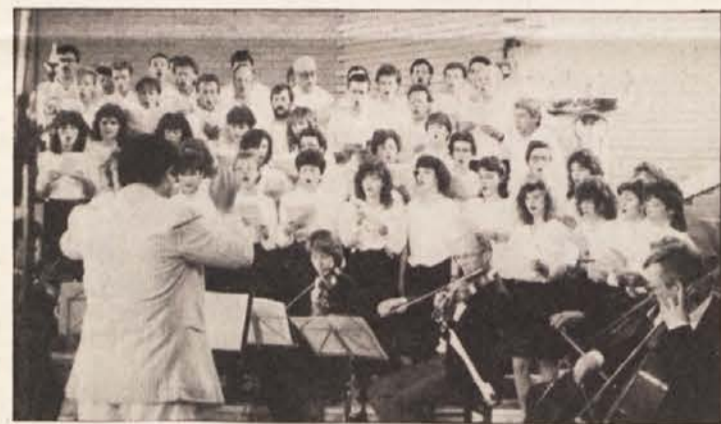
Zbor Danice in Slovenska filharmonija

nost pomembne teme. Povezala se je s posameznimi zbori, ki so potem naštudirali ustrezne pesmi.