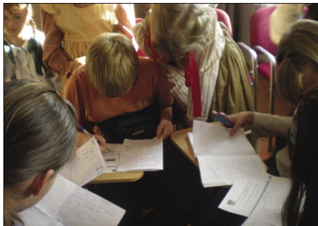
Reševanje testov o drugih manjšinah v županiji

Bila sem zelo ponosna na naše učence, kajti čeprav smo majhna šola, imamo zelo malo učencev, se nam