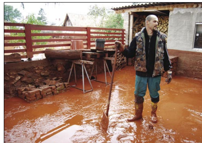
Tau je skurok nej mogauče kraj spucati

lidij iz vesnic Kolontár in Devecser je bilou ranjenih. Zavolo té ekološke katastrofe je zastrupljenih najmenje 40 kvadratnih kilometrov površine, ena največji industrijskih nesreč v rosa-gi, štera že vala za okoljsko katastrofo velikih razsežnosti, pa je ogrozila tudi reko Rabo, prejk nje pa ške Donavo. Madžarski premier Viktor Orbán, steri je tretji den po nesreči obisko