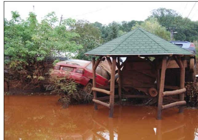
Redeče blato je mlelo vse pred sebov

Prejšnji ponedeljek je nej samo na Vogrskom, liki po cejlom svejti zaokročila novica, ka je v kraji Ajka, gde je popüsto nasip, vö steklo okauli milijon kubičnih metrov strupene odpadne snovi. Na svojoj rušilnoj pauti je tau redeče blato zalezalo tudi kauli 400 ramov, štirge lidje so mrlji, tri pa ške iščejo. Več kak 120