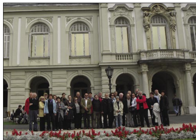
Skupinski posnetek na ploščadi gradu Festetics v Keszthelyu. Manjkal ni niti ogled obale Blatnega jezera