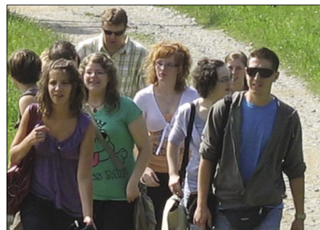
Skupina mladih arhivarjev