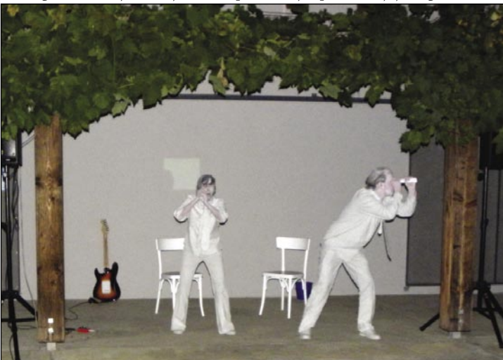
Vizualni del Prostorskih odmevov smo spremljali v prijetnem jesenskem večeru pred razstavno dvorano Pavlove hiše

iskanja. Čas potem poskrbi za preživetje tistega, kar prinaša