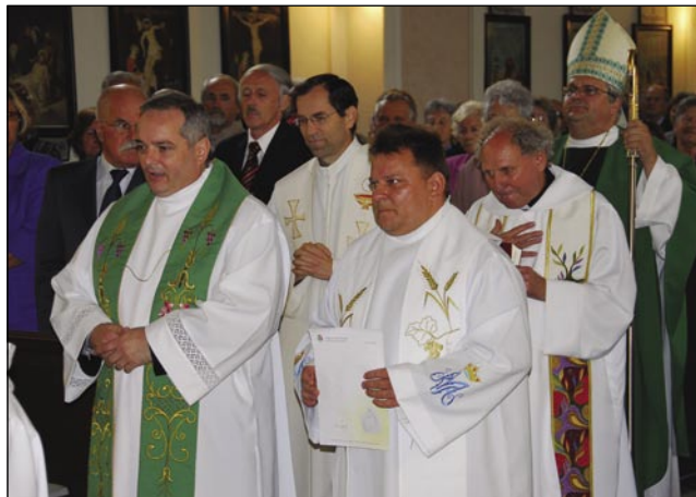
Na slovenski meši ob odprtji Küharove spomivske iže

»Tau ne ovadim, zato ka te mi više pride zavolo tauga, ka vsakši de mi samo tau ponüjo.«