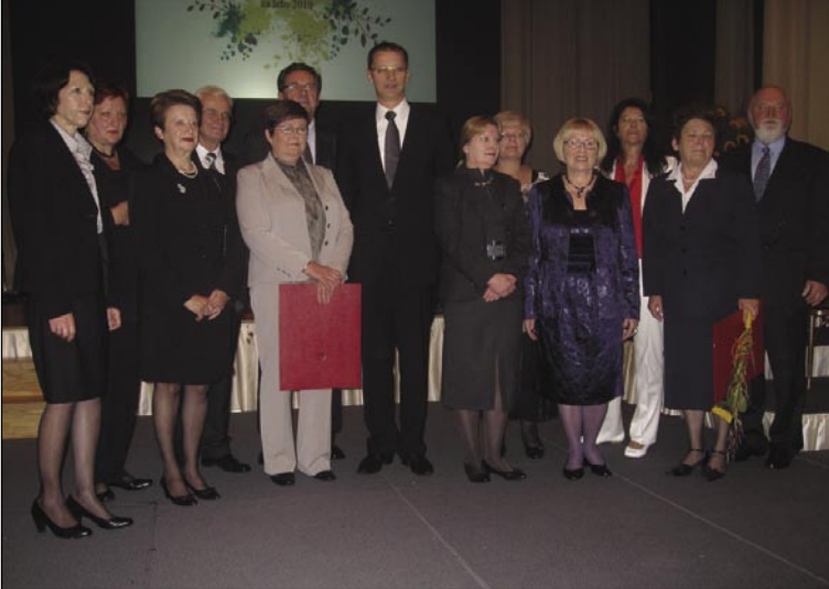
Vsi letošnji nagrajenci z ministrom za šolstvo in šport dr. Igorjem Lukšičem

Predušem po njeni zaslugi vidijo starši šoloobveznih otrok v Porabju znanje slovenščine kot nekaj zaželenega, kar pomeni dragoceno spodbudo ohranjanju in razvijanju slovenstva v Porabju. Nagrajenka pa