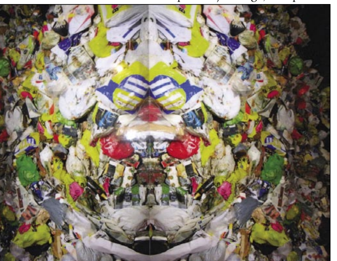
Eno izmed likovnih del z razstave in dogodka Prostorski odmevi v Pavlovi hiši

primernejše iz kulturnega festivala graške Štajerske jeseni, ali bi nemara v Pavlovo hišo prenesli nekoliko manj izzivalno umetnost, je vpraša-