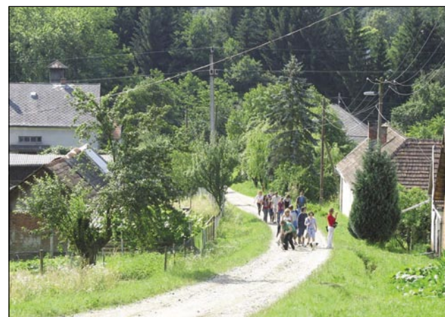
Lani so udeleženci tabora hodili po Gornjem Seniku