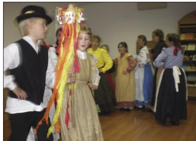
Nastop otroške folklorne skupine DOŠ Števanovci

Društvo za širjenje znanosti (Delavska univerza) v Szombathelyu, na njej so se zbrale štiri manjšine, Hrvati, Nemci, Romi in mi, Slovenci. Aktivno sodelovanje se je začelo že prej, kajti vsaka manjšina