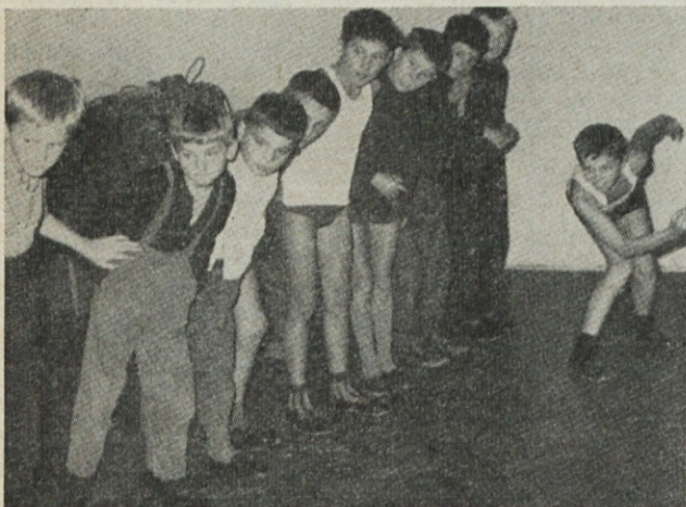
Pionirji v telovadnici TVD Partizana Jarše. Telesna vadba in igre izpopolnjujejo urnik.