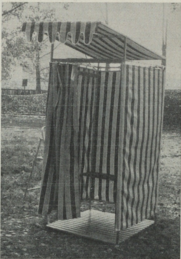
Kabine za kopaljšča so naš najnovejši izdelek. Možnost serijske montaže in odlična kvaliteta tkanine v živahnih barvah. Ogrodje: aluminij; tkanina: Leacril