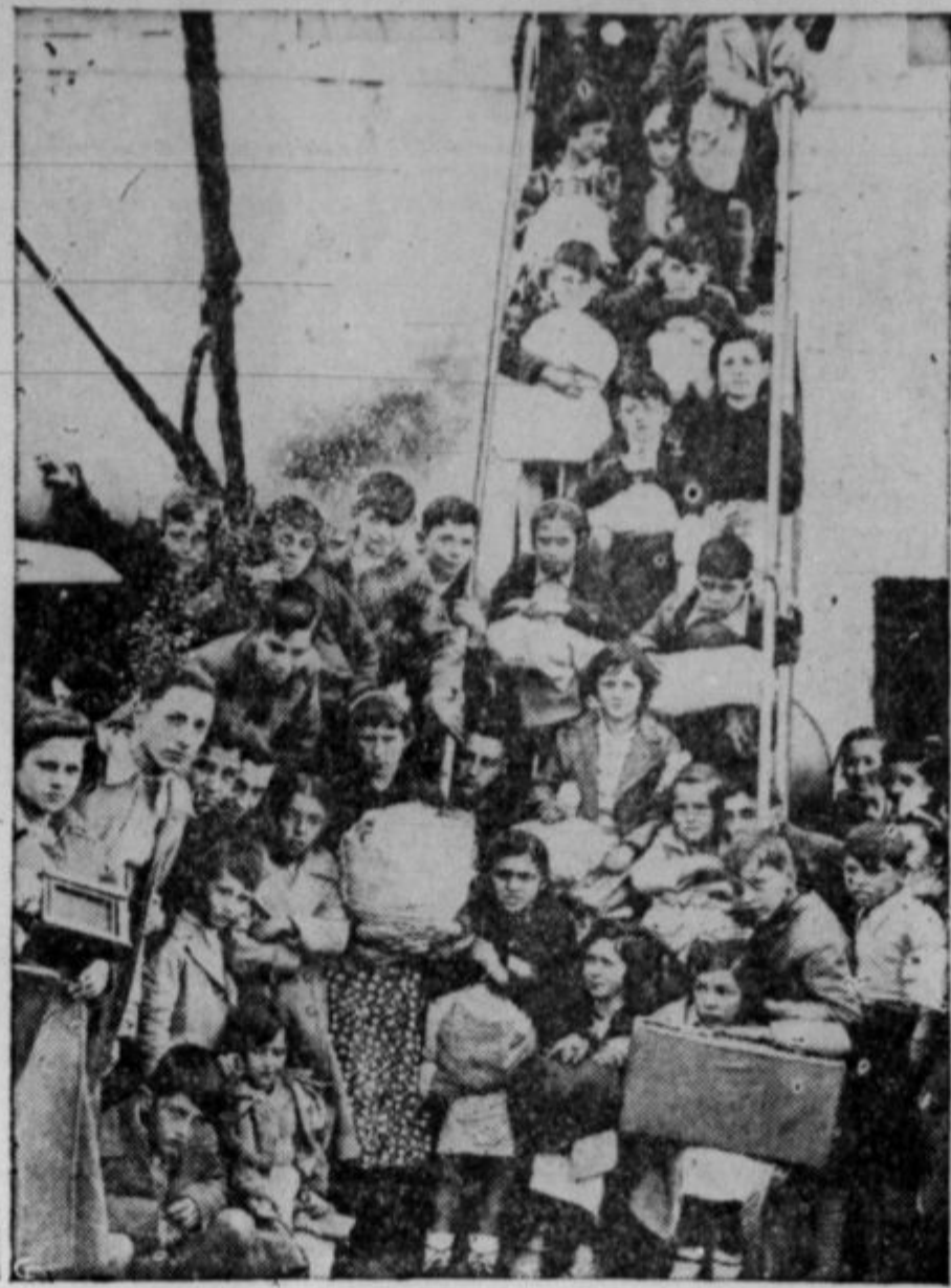
Angleški delavci so sprejeli v svojo oskrbo iz Španije okrog 5.000 otrok, katerim so vzeli roditelje španski fašisti s pomočjo nemške in italijanske armade. Na gornji sliki je skupina španskih otrok, ki je dobila začasno zavetje v Angliji. Prišli so iz Bilbao predno so ga zavzele fašistične čete.