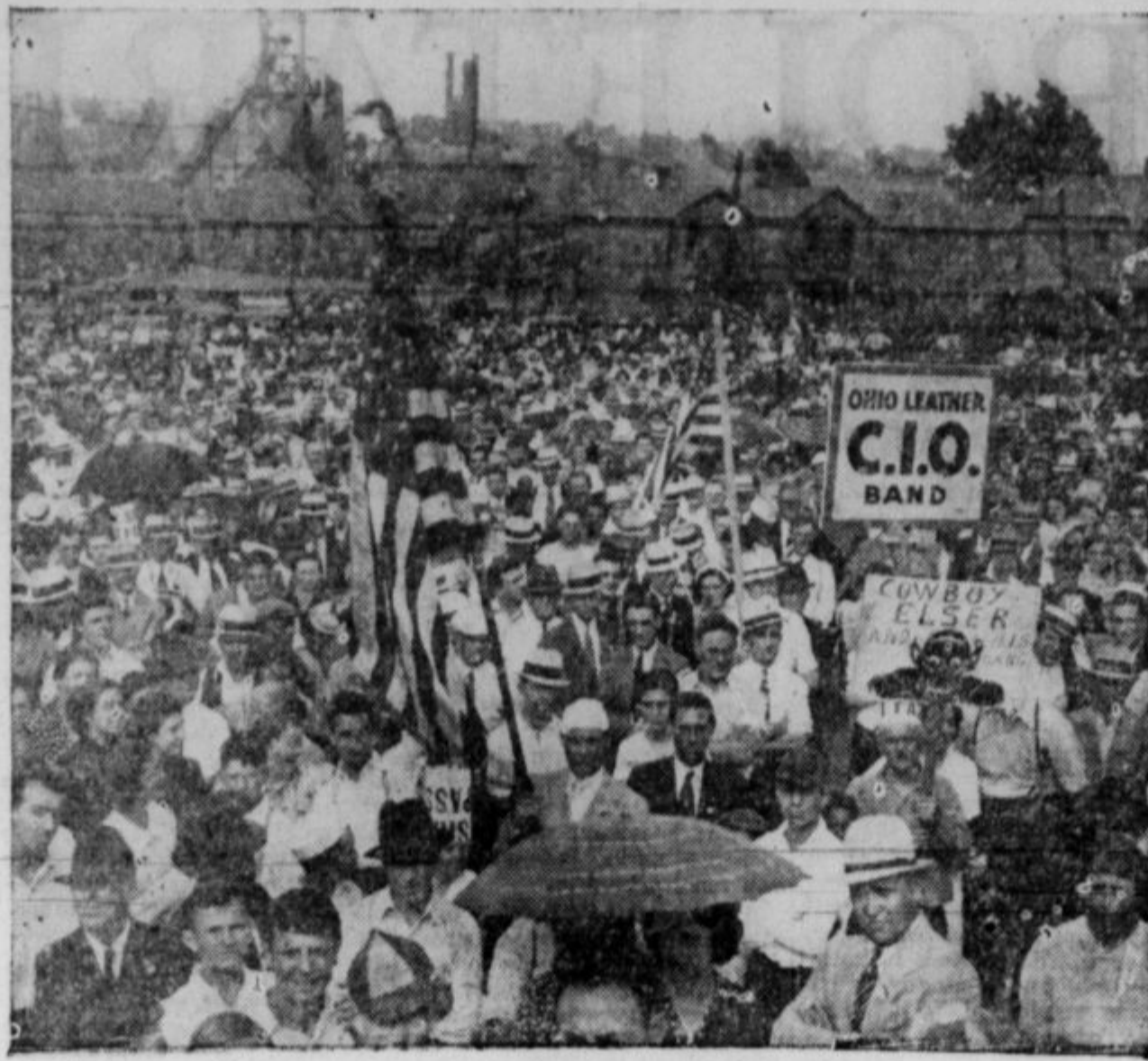
Prizor s stavke delavcev, organiziranih v unijah CIO v Ohio.

Savin "moonlight" piknik je letna institucija klubovega pevskega zbora. Prirejen je deloma za zabavo in razvedrilo in