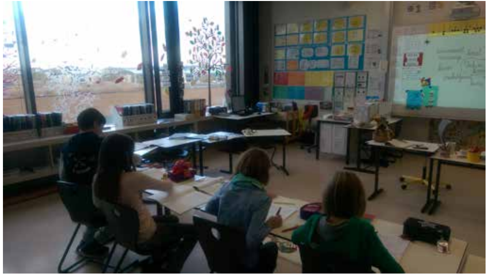
Slika 4: Pouk slovenščine v Evropski šoli Luksemburg II (2016).

teljev slovenščine (dva v Bruslju, dva v Luksemburgu in en v Frankfurtu), med vodstvenim osebjem pa 2 pomočnici direktorja, na primarni stopnji v Evropski šoli Frankfurt in Evropski šoli Bruselj I. V sistemu je tudi 7 honorarnih učiteljic slovenščine z manjšo učno obveznostjo, ki jih Evropske šole zaposlijo in plačujejo neposredno (od tega 1 učiteljica poučuje na daljavo iz Slovenije).