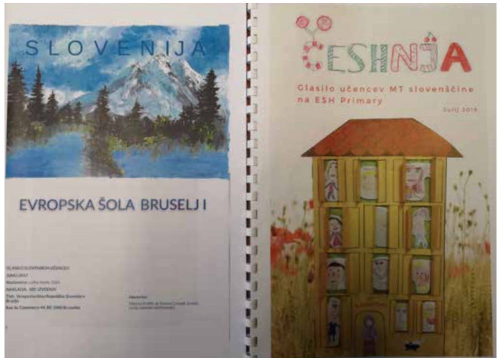
Slika 6: Šolsko glasilo slovenskih učencev Evropske šole Bruselj I (2017) in akreditirane Evropske šole Haag (2019).