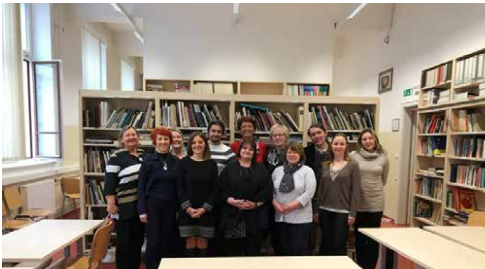
Slika 5: Redno letno izobraževanje učiteljev slovenščine v Evropskih šolah v organizaciji MIZŠ in ZRSŠ (Evropska šola Ljubljana, 2018).

Republika Slovenija si že več kot desetletje prizadeva ( Informacija o pouku slovenščine v okviru jezikovne sekcije v Evropski šoli Bruselj I na primarni stopnji izobraževanja , 2007), da bi v Evropski šoli Bruselj I ustanovili slovensko jezikovno sekcijo, v kateri bi pouk vseh učnih predmetov potekal v slovenskem jeziku, vendar zaradi premajhnega števila slovenskih učencev (število pa se je v zadnjem šolskem letu še dodatno zmanjšalo) to ni mogoče, tako v šolskem letu 2020/21 slovenščina v tej šoli ostaja učni predmet.