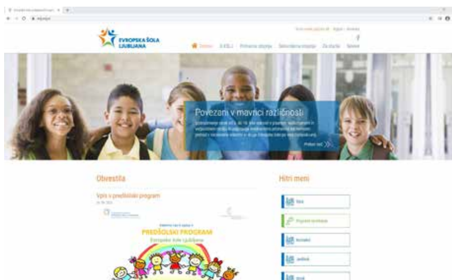
Slika 2: Spletna stran Evropske šole Ljubljana. ( https://eslj.sclj.si/ )

Akreditiranih Evropskih šol je trenutno 18, od tega največ v Luksemburgu, Franciji in Italiji, 6 šol pa je v akreditacijskem postopku ( Locations of the Accredited European Schools , 2020). V Sloveniji od 1. 9. 2018 deluje Evropska šola Ljubljana z angleško in s slovensko jezikovno sekcijo na primarni ravni izobraževanja, s 1. 9. 2020 pa tudi v prvem obdobju sekundarne ravni izobraževanja ( Pravilnik o izvajanju programa Evropske šole Ljubljana , 2018).