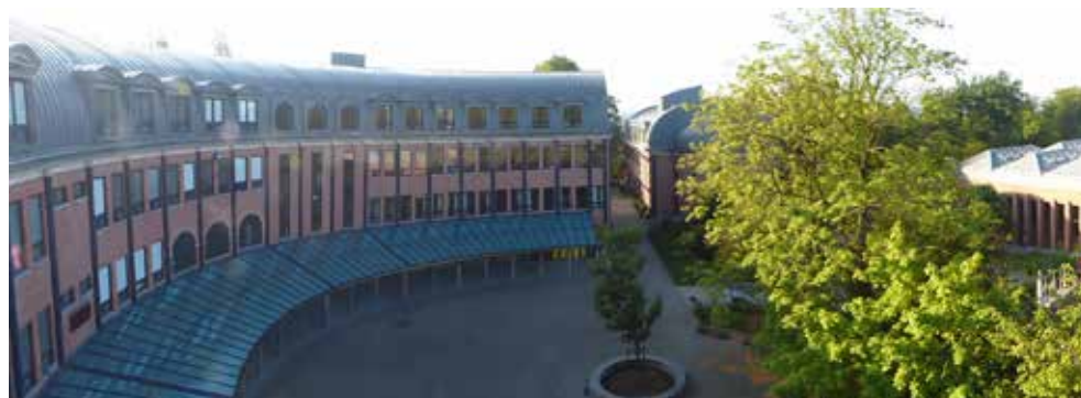
Slika 1: Evropska šola Bruselj I. ( http://www.eeb1.com/en/welcome/ )

Republika Slovenija je pravico do izobraževanja otrok slovenskega osebja evropskih institucij in stalnih predstavništav držav članic v Evropskih šolah pridobila aprila 2004 z ratifikacijo Konvencije o statutu Evropskih šol. Z izvajanjem pouka slovenščine je začela v šolskem letu 2004/2005 v Evropski šoli Bruselj I, kjer je še danes vpisanih največ slovenskih otrok, kasneje tudi v Evropskih šolah Luksemburg II, Karlsruhe in Frankfurt na Majni, München, Varese in Bergen.