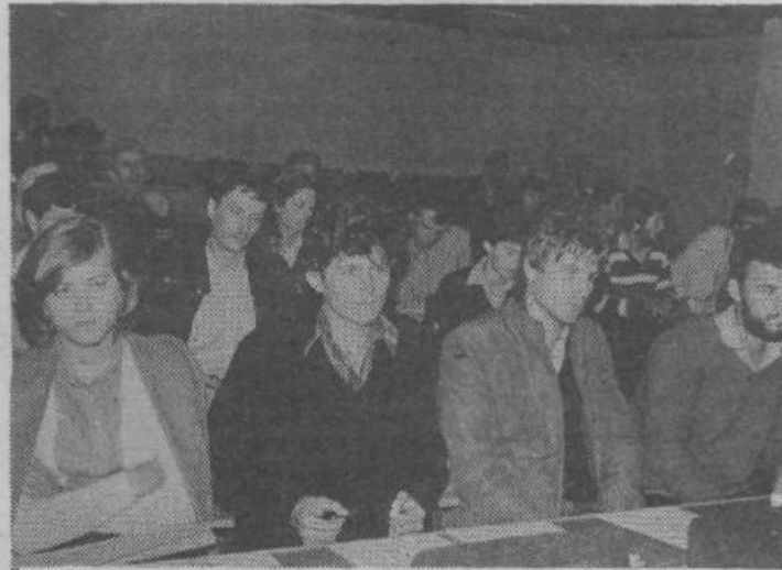
Število osnovnih organizacij ZSMS se je povečalo — so ugotovili mladi na svoji zadnji seji občinske konference

V TEJ ŠTEVILKI NAŠE SKUPNOSTI TUDI UMETNIŠKA PRILOGA 25. MAJ!