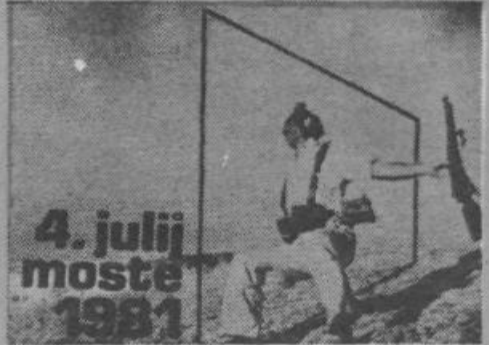
4. julij moste 1981

Ob praznovanju dneva borca v Ljubljani in ob novi delovni zmagi vas delovni ljudje in občani občine Ljubljana Moste-Polje