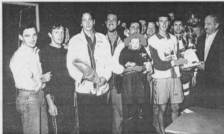
L'Alborella di Cemur durante le premiazioni dello scorso anno