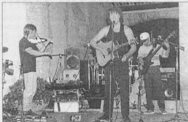
Il concerto dello scorso anno nella piazzetta di Clenia

A Cividale, in piazza Duomo, sabato 4 luglio si