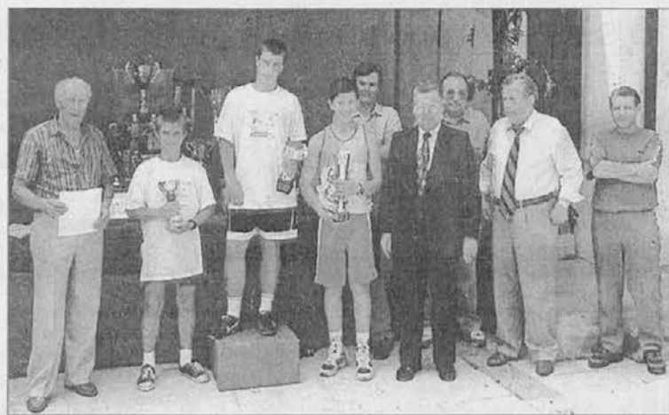
Dva momenta nagrajevanja

deljskega mednarodnega pohoda iz Podbele oziroma