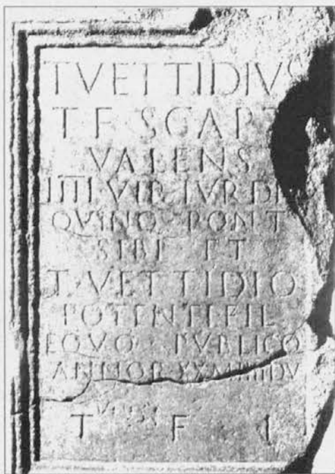
Lapide con iscrizione funeraria di Titus Vettidius, valente magistrato della tribù romana Scaptia, alla quale si ritiene ascritta anche Forum Iulii

Le tracce archeologiche delle mura romane non riguardano dunque la cerchia più antica, ma la seconda, in cui si apriva-