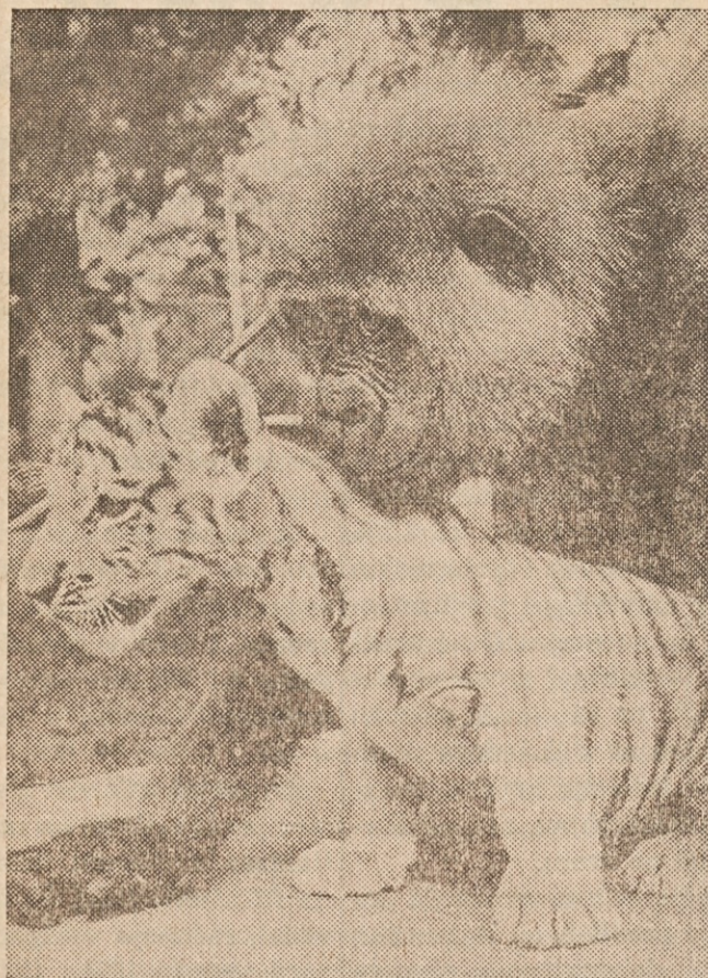
MIRNO SOŽITJE, TODA KAKO DOLGO? — "Tovariši", sibirski tigar, ki se ni zrastel do nevarne dobe, je gost tri leta stare gorile Kumba v živalskem vrtu v Lincolnu parku v Chicagu. Za enkrat se oba kar dobro razumeta, vprašanje je, kako dolgo bo pri tem ostalo.

govoriš, da odideš. Bodi! Zato pri meni, postava jo meni izročā. pa mene pogodba nič več ne Pogodba je odpovedana, in jaz veže. Jeanne je moja in ostane jo lahko vzgajam po svojih na-