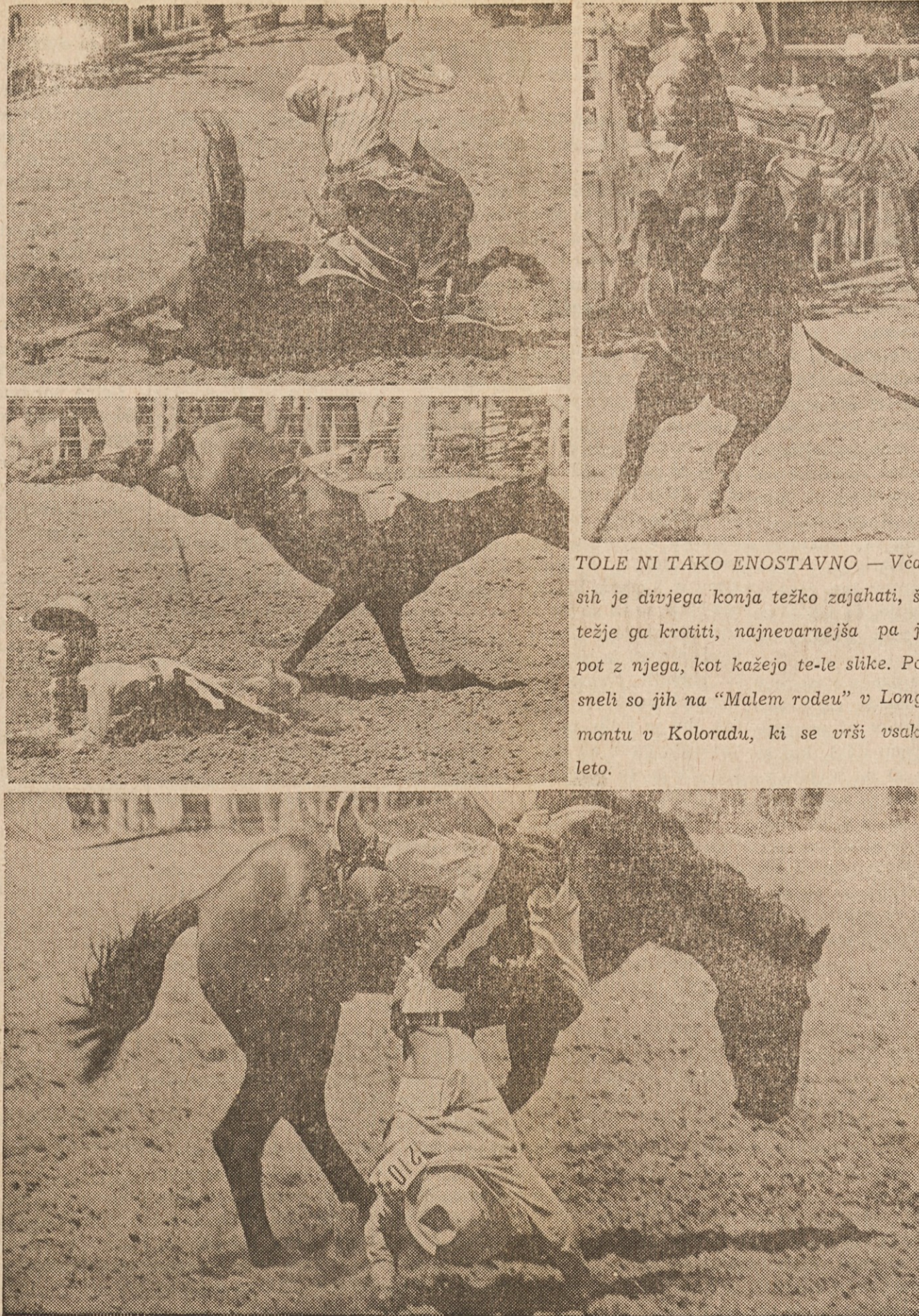
TOLE NI TAKO ENOSTAVNO — Včasih je divjega konja težko zajahati, še težje ga krotiti, najnevarnejša pa je pot z njega, kot kažejo te-le slike. Posneli so jih na "Malem rodeu" v Longmontu v Koloradu, ki se vrši vsako leto.

"Torej ti je ljubše, da se uniči!" reče na trdo. "Da, ako mi zabraniš cerkveno poroko, tedaj si uničil naše družinsko življenje. Jaz bi ne mogla ostati, čutim, da mi je to nemogoče. Ne prenesla bi tega, da bi živela s teboj, nosila tvoje ime, da bi bila tvoja žena, pa da bi ne bila tvoja pred Bogom, čemur nasprotuje samo tvoja prevzetnost. Prenašala sem to — kako težko in koliko časa! — ker je vladal nepremagljiv zadržek. Rekla sem si: Storim, kolikor morem svojih krščanskih dolžnosti v razmerah, ki so močnejše, nego je moja volja. Sedaj pa, ako mi tega ne dovoliš, moram oditi, ker mi ni več obstanka pri tebi. Odgovori mi, ali mi privoliš, da grem stran od tebe? ... Ti govoriš o žalitvi, o madežu. Kakšno življenje bi bilo to, ako opravi obreč, ki nama ji bil dosedaj prepovedan, ki pa je nama sedaj dovoljen? Kak madež bi bil tak zakon, ki zate, ker ne veruješ, nič ne pomeni? Ponomim ti, ako mi to odrečeš, tedaj v tebi napuh zmaga nad ljubeznijo. Samo napuh! Ti ne maraš, da bi moja vernost zmagala nad tvojo nevernostjo."