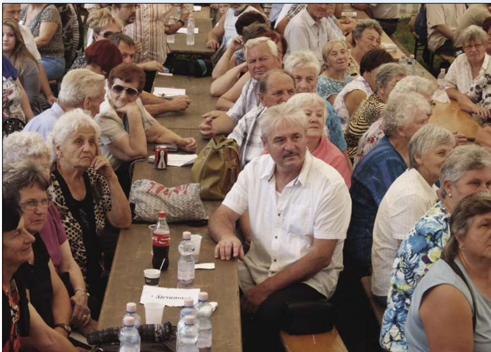
Na Porabski den ali Srečanje Slovencev so prišli ligdé iz vsej vesnic Porabja, dapa prišli so domau tisti tō, steri so odlišli zavolo krüja ali lübezni v druge kraje rosaga.