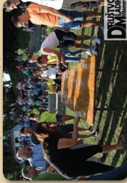
Pomerili so se tudi gledalci