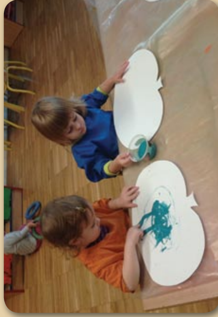
Barvanje buč s prstnimi barvami