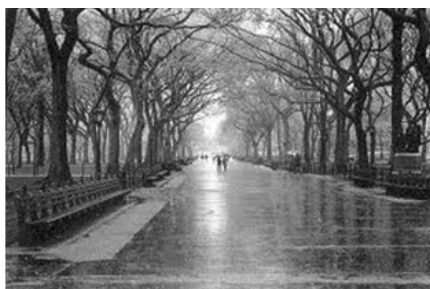
Pri stalnem dežju je življenje najbrž grozno

Najbolj mokri kraj na svetu je Čerapundži v Indiji , v pokrajini Asan. Vlažnost je način življenja za 10.000 ljudi, ki kljub vsemu živijo v tem kraju. Noben prebivalec tega mokrega kraljestva v resnici nikoli ni občutil, kaj je suho. Vedo le za manj ali bolj vlažno. Čerapundži leži na 1484 metrih nad morjem in ima svetovni rekord v količini padavin v enem mesecu. Posebnost tega kraja so tudi hudi nalivi v jutranjih urah. Največ deževnih dni, povprečno 325 na leto, je v BAHIA FELIXU v Čilu. Na najbolj mokri točki na svetu, na gori Mount Wai' de na Havajih, pa nikoli ne rečejo, da dežuje, tam vedno lije.