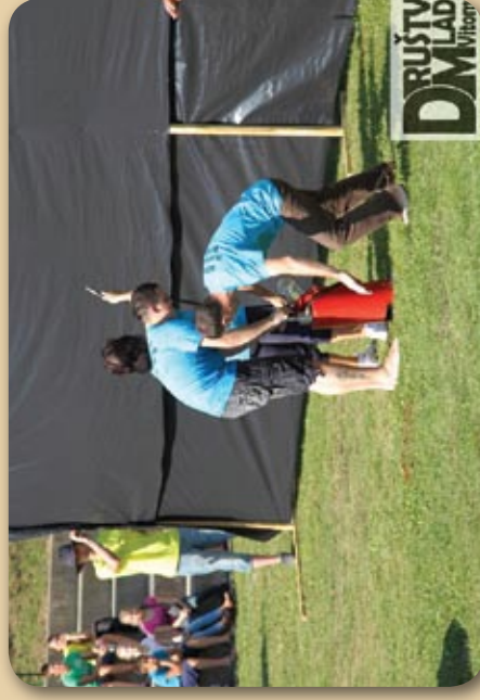
Pumpaj, pumpaj gasilec moj