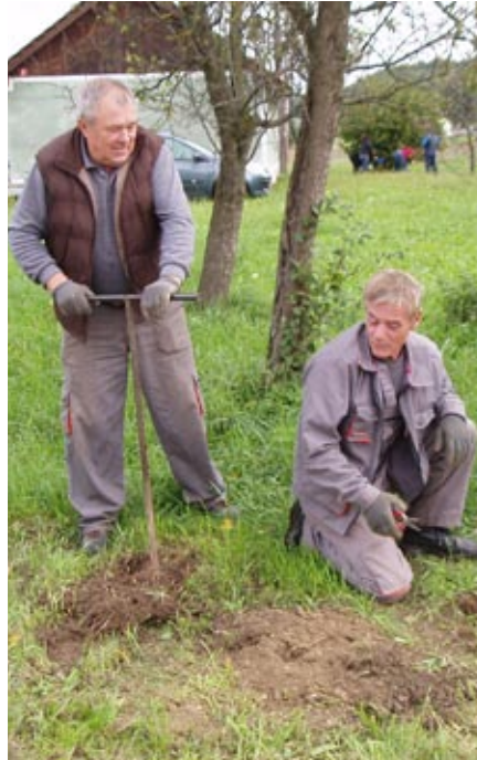
Priprava terena za postavitev kozolcev

Drugi projekt Učna pot in usmerjevalne table zajema pripravo Andraževa učne poti (izdelava zloženke Andraževa učna pot v slovenskem in angleškem jeziku – opis vseh 10 točk ob poti, izdelava označevalno-razla-