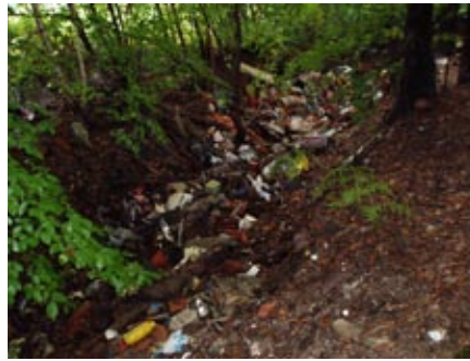
Črno odlagališče v Slavšini

Neverjeten in žalosten je pogled na že očiščeno črno odlagališče v Slavšini, ki ga je nekdo spet napolnil. Ker v letu 2012 v okviru čistilne akcije nismo uspeli očistiti čisto vseh odpadkov s tega odlagališča, smo to naredili letos spomladi. Kar nekaj prostovoljcev – naših občanov se je trudilo in kopalo po smeteh, bilo je odpeljanih kar nekaj polnih prikolic s tega mesta in to z brezplačnim prevozom. Nekomu ni mar za vse to, ne za ljudi, ki se trudijo in ne za naravo, ki ji dela škodo. Kdorkoli je to naredil, bi moral biti kaznovan. Odlaga-