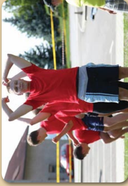
Podaj mi gajbo piva