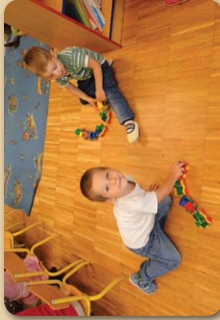
Kolone vozil se vijejo po naši igralnici