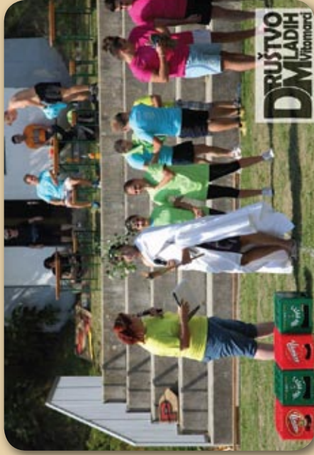
Povezovalca iger sta z gore Olimp prinesla olimpijski ogenj