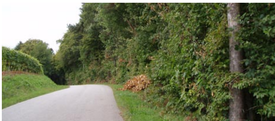
Bolj pregledne in bolj varne ceste