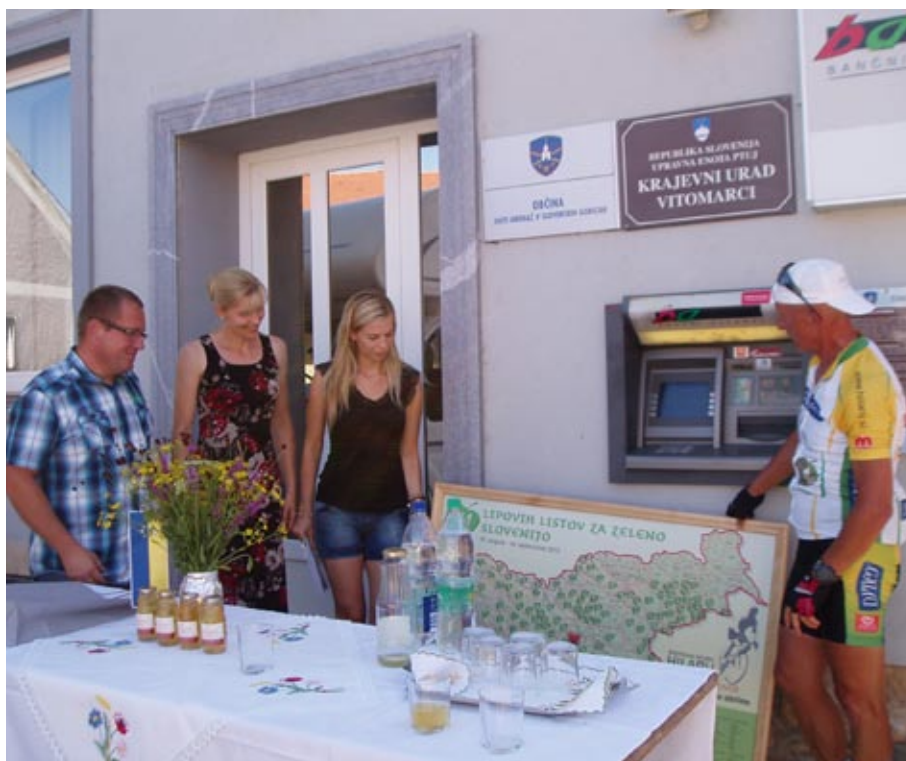
Sprejem pred občinsko stavbo