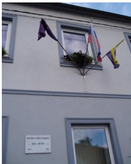
Spominska plošča učitelju Ivanu Strelcu