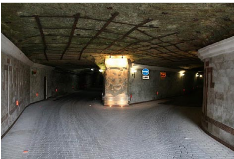
V klet se vozijo po pravih prometnih poteh

Kakor prihaja na mizo vino, tako odhajajo skrivnosti.