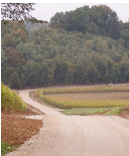
Dela na cesti Mala Slavšina-Roškar-Gibina

V okviru projekta, odobrenega na razpisu MGRT za 21. člen ZFO, smo izvedli modernizacijo dveh odsekov cest. Asfaltiranje odseka ceste Mala Slavšina–Roškar Gibina od hišne številke Slavšina 56 do ceste Rjavci–Gibina v skupni dolžini 558 m in asfaltiranje ceste Gibina - Slana v skupni dolžini 150 m. Vrednost izvedenih del znaša skupaj z DDV 78.350 €, od tega bomo po pogodbi z MGRT o sofinanciranju po 21. členu ZFO prejeli 49.752 € nepovratnih sredstev.