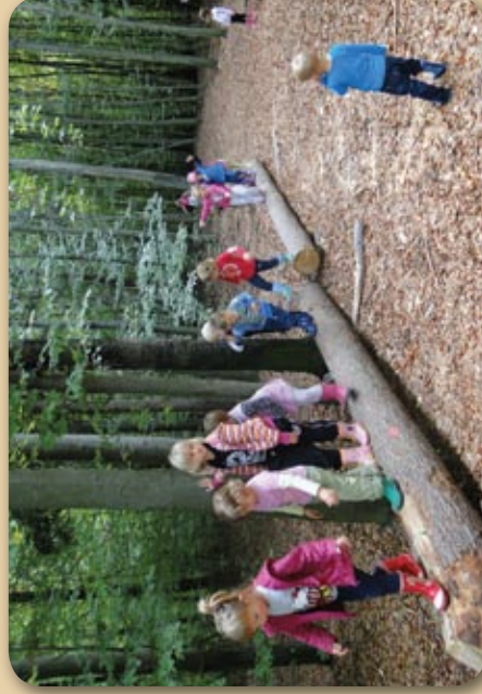
Dobra vaja za ravnotežje