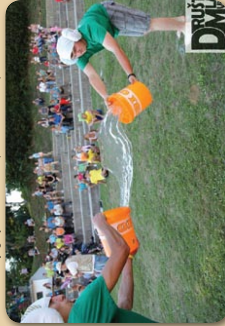
Tako si pa vodo podajajo sloni in slonice