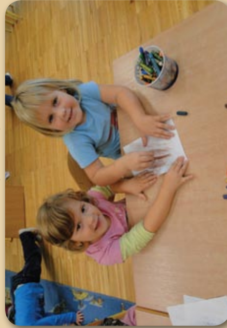
Protiramo orehove liste