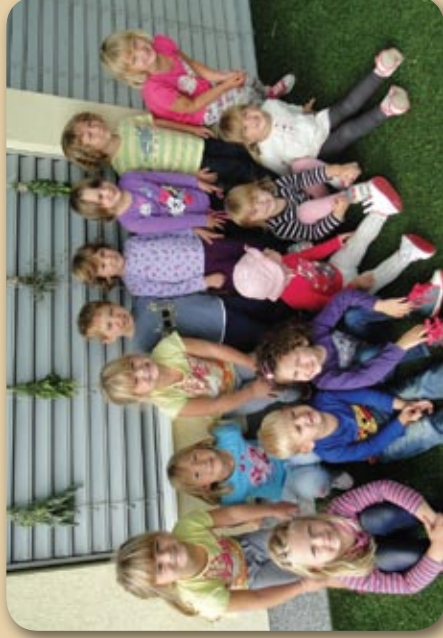
Sušenje zelišč z naše zeliščne gredice