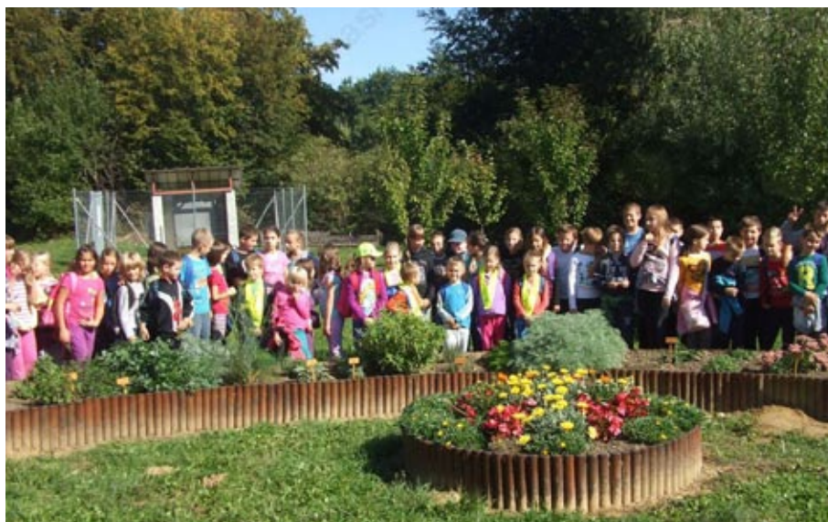
Učenci OŠ Vitomarci pri zeliščnem vrtu

Ob otvoritvi Andraževe učne poti se zahvaljujemo vsem domačinom, ki so vedno znova pozitivno pristopili k projektu, v njem sodelovali ter dovolili potek poti po njihovem