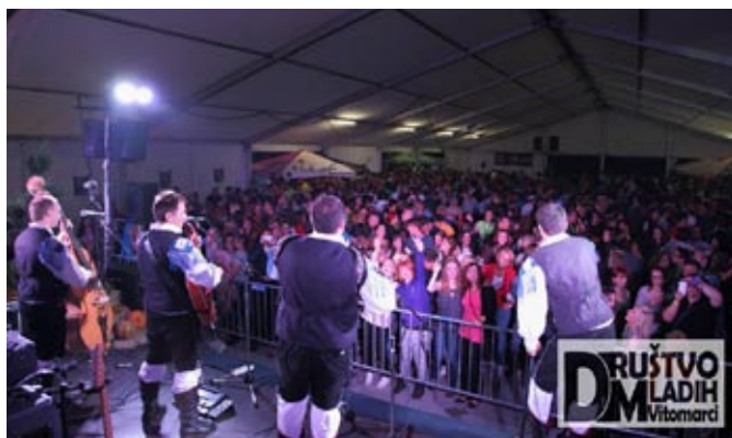
Modrijani so dvignili temperaturo