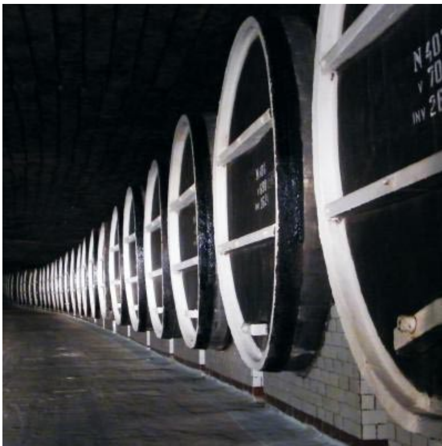
Podzemna veletovarna vina

Največja vinska klet na svetu se nahaja v Moldaviji, v MILESTII MICI, dvajset kilometrov južno od moldavijske prestolnice (glavno mesto Moldavije je KIŠINJEV s 740.000 prebivalci). Ustanovljena je bila leta 1969 v opuščenem rudniku apnenca. Najprej je bilo tam le manjše skladišče vina, ki je pozneje preraslo v pravo podzemno veletovarno vina. Grozdje, mošt in vino v MILESTII MICI dovažajo iz vse države, v podzemnih tunelih pa se izvajajo vse stopnje tehnološkega postopka do ustekleničenja in arhiviranja. Skupna dolžina podzemnih rogov rudnika, ki so ga za izkop gradbenega apnenca izrabljali kar pol tisočletja, je 220 km, 120 km jih je danes v uporabi. V podzemlju sta vse leto stalna temperatura (od 12 do 14 stopinj Celzija) in vlaga (od 85 do 95 odstotkov). V opuščenem rudniku je pravo podzemno mesto. Posamezni rovi so poimenovani tako kot ulice v mestih. Po ulicah, ki nosijo imena vinskih sort in zvrsti, se zaposleni in obiskovalci prevažajo z avtomobili, prometnejše pa so opremljene s prometno signalizacijo. Levo in desno lahko obiskovalci kar iz avtomobila opazujejo velike cisterne in velike