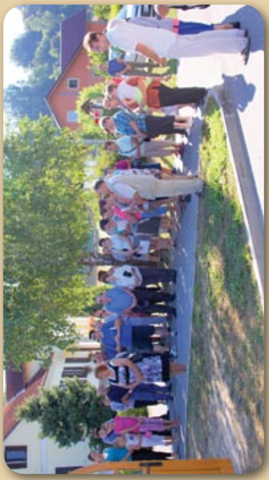
Pohod oz. romanje od kapele, 17. avgust 2013