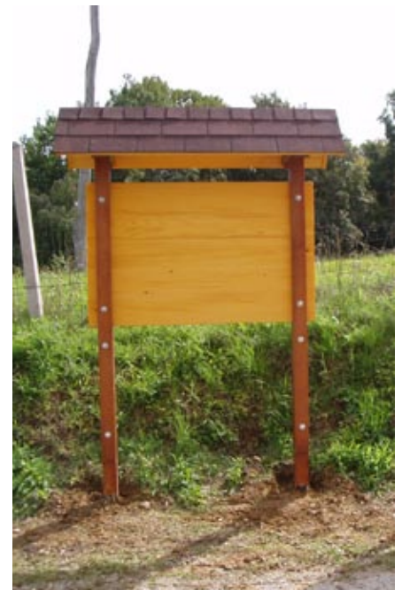
Postavljena reklamno-obveščevalna tabla (kozolec)

galnih tabel ob dotični točki, oprema zeliščne gredice in izdelava velike razlagalne table z zemljevidom poti pri POŠ Vitomarci), reklamno-obveščevalne table (kozolci) in usmerjevalno-krajevne table (smerokazi). Vrednost projekta skupaj znaša 8.941 €, od tega bomo prejeli 3.884 € nepo-