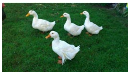
Zaradi izdajstva so gosi morale umreti

Legenda o gosih pravi, da se je Martin skrtil med gosi pred ljudmi, ki so mu prišli povedat, da je bil izvoljen za škofa. Gosi so ga izdale z gaganjem, zato so morale za kazen umreti na dan njegove smrti (8. novembra 397).