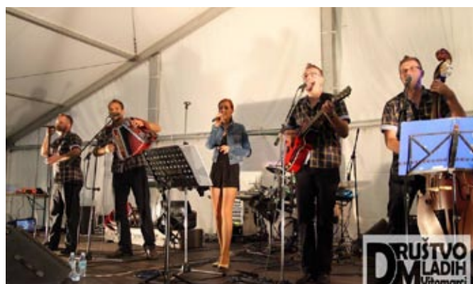
»Mladih 5« - »ogrelo« občinstvo