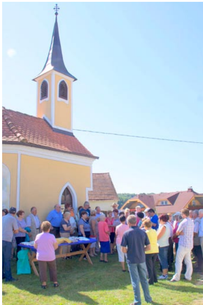
Romarji pri kapeli v Hvaletincih