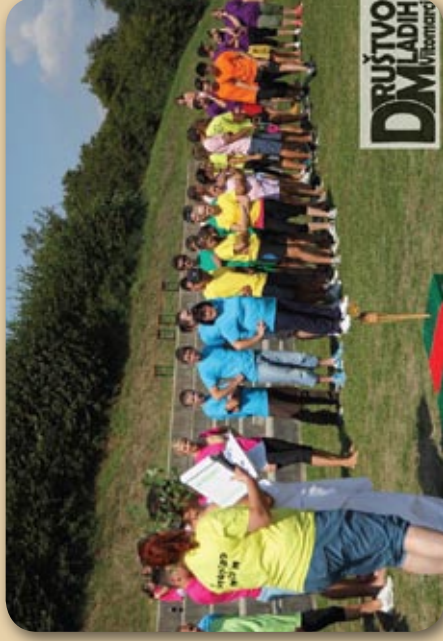
Predstavitve ekip in prve igre