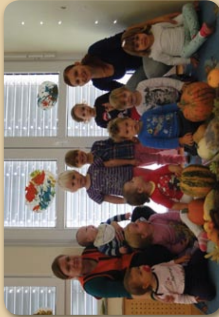
Pozdravljena teta jesen