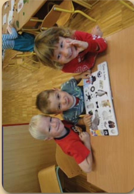
V knjigah je mnogo zanimivosti