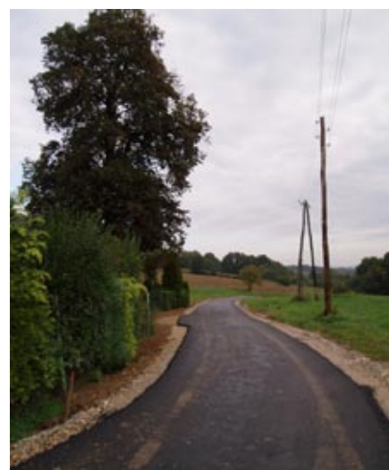
Nov asfalt na cesti Gibina-Slana