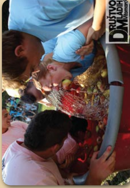
Ugrizni banano ali pa vsaj v jabolko