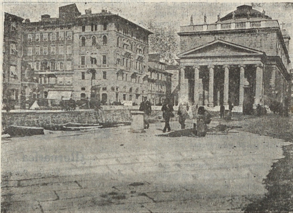
Trst — Župna cerkev Novega sv. Antona.

Nas mornarica tem bolj veseli, ker smo Primorci in spoznamo njene vsestranske dobrote. O da bi država storila za svojo mornarico vse, kar more — kako bi se to izplačalo. In to mora storiti tem prej, čim bolj se druge države trudijo, da izkoristijo tudi naše morje.