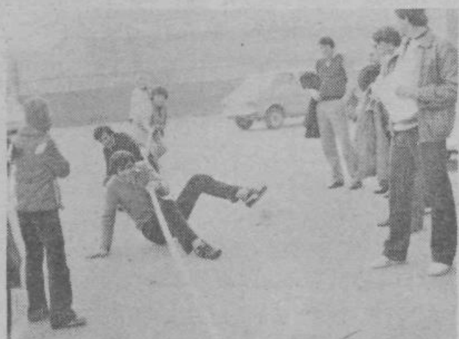
Ekipe BTC Ljubljana je očitno pričakovala močnejšega nasprotnika