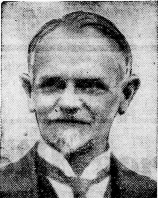
Znani sovjetski politik in diplomat, ki ga je pa zasenčila slava Litvinova