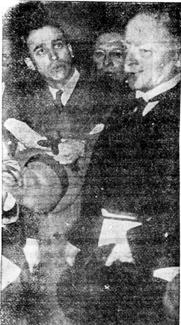
Na sliki vidimo predsednika odstopivše belgijske vlade de Broquevilleja v pogovoru z novinarji po povratku od kralja