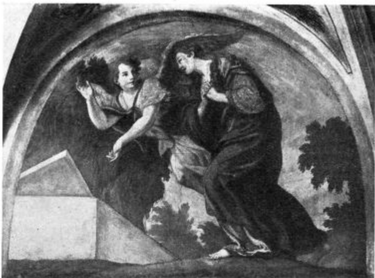
Magdalena ob grobu Jezusovem. (Ljubljanska stolnica. Glej: Naše slike!)

Na tisoče človeških zmot in krivih naukov se je že razbilo ob božji resnici, ki nam jo je oznanil Kristus in jo ohranja na veke katoliška Cerkev. Božja resnica stoji nepremagana,