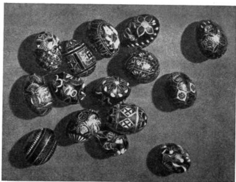
Simbol Jezusovega groba in vstajenja.

Zdravnik: Ampak to je močno enostransko gledanje. Imam pa že rajši pravičnega pa najsi še tako strogega gospodarja, kot pa popustljivost in nedoslednost, da človek nikoli ne ve pri čem je. Ne glede na to, da bi