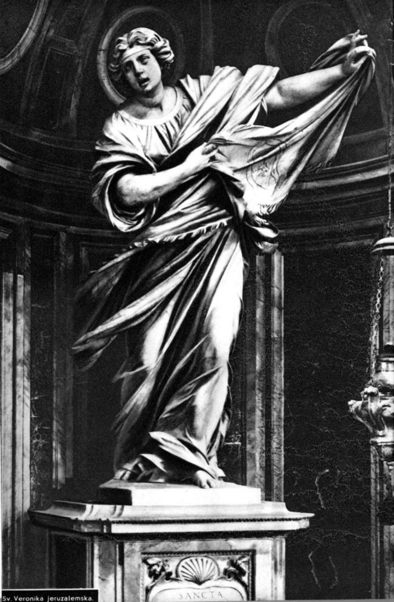
Sv. Veronika jeruzalemska.