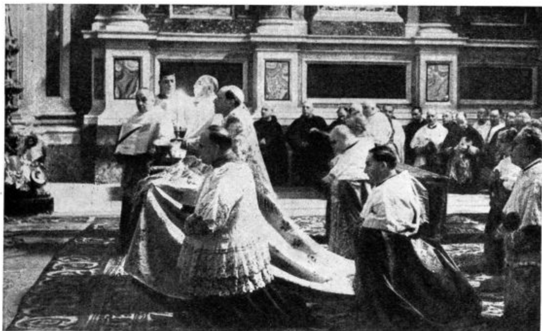
Sveti oče Pij XII. moli za mir v cerkvi Marije Snežne, kjer je imel novo mašo 3. aprila 1899.

novorojenček potrebuje, je hrana in negovanje. Toda, ali je to res tako veliko, da bi zdrav in kreposten mož, da bi ljubeča mati tega ne zmogla? Prav gotovo je, da se v kolikortoli rednih in urejenih razmerah ne more dogoditi, da bi kaka dobra in zdrava družina zaradi gladu in pomanjkanja propadla. Zaradi gladu in pomanjkanja propadajo le otroci razrvanih in manjvrednih družin ali brezvestnih staršev, drugi pa se morajo zadovoljiti z — malim. Odpovedati se morajo že od mladih nog marsikateri udobnosti, zatreti morajo marsikatero muhasto hrepenenje. Toda to jim je le na korist, ker postanejo tako skromnejši in odpornejši ter tudi bolj sposobni za življenjski boj. In ta ne prizanaša nikomur. Še najmanj pomehkuženim sinčkom in hčerkicam preveč mehkih staršev. Kar je pa najhuje: Greh teh preveč sebičnih staršev bo kot grozovita mora ležal tudi na plečih razvajenih potomcev, umetno ohranjenih in pogrešeno vzgojenih edincev.