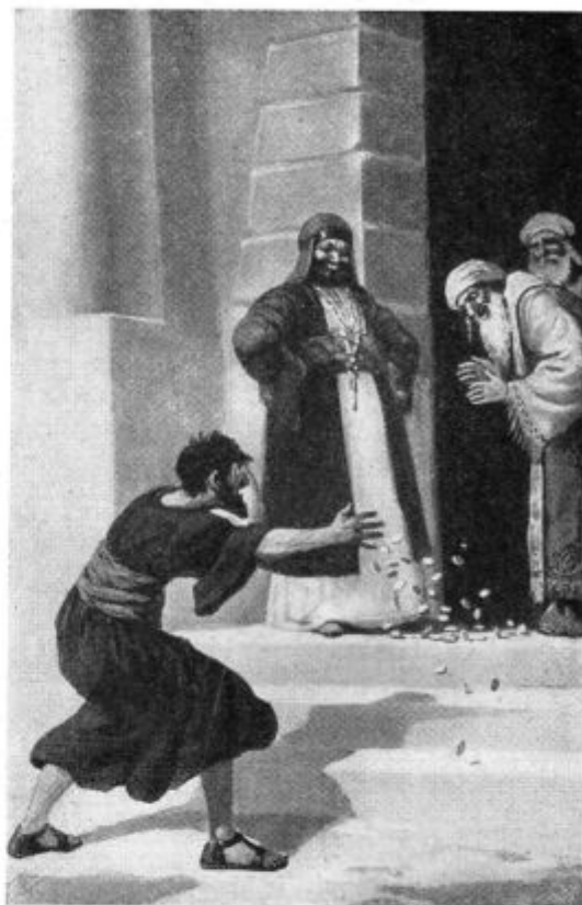
Juda izdajavec — obupa.

Tako bodo člani (družine) deležni ne le nadnaravnih milosti, ki jih nudi vestno spolnjevanje bratovskih pravil, ampak bodo kot