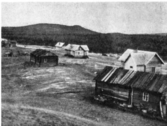
Laponska naselbina na jasi sredi pragozda.

Vse drugačen je bil spet način božjega govorjenja, ko je v puščavi med gromom in