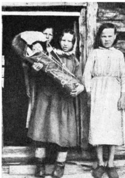
Laponski otroci z laponsko zibelko na Finskem.

»Nič. Dal sem tvojemu vprašanju primeren odgovor. Hočem te pa opozoriti na nekaj drugega. Ne palica, ne šiba, moč lepega zglada bo pri vzgoji naredila več ko vsaka kazen in vsako strahovanje. Tudi v vrstah KA je moč lepega zglada neizogibno potrebna! Za danes imate spet kar dosti, a naših pogovorov še ni dosti. O polje KA, kako si obširno!«