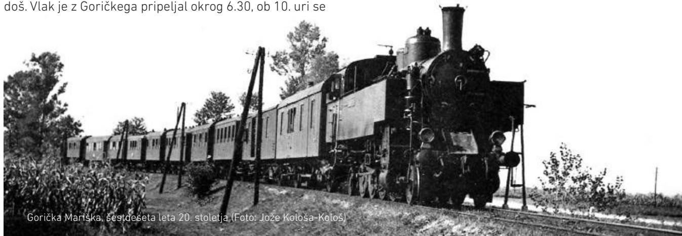
Gorička Mariška, šestdeseta leta 20. stoletja