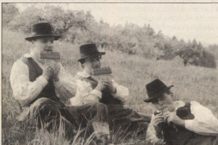
Trio KURJA KOŽA želi ne samo predstaviti značilna glasbila in glasbo štajerskega področja, temveč poskuša oboje smiselno povezati in tako ustvariti vzdušje in utrip tega področja.

Nedelja, 7. januarja, ob 14.30 v kulturnem domu v Šentjakobu.