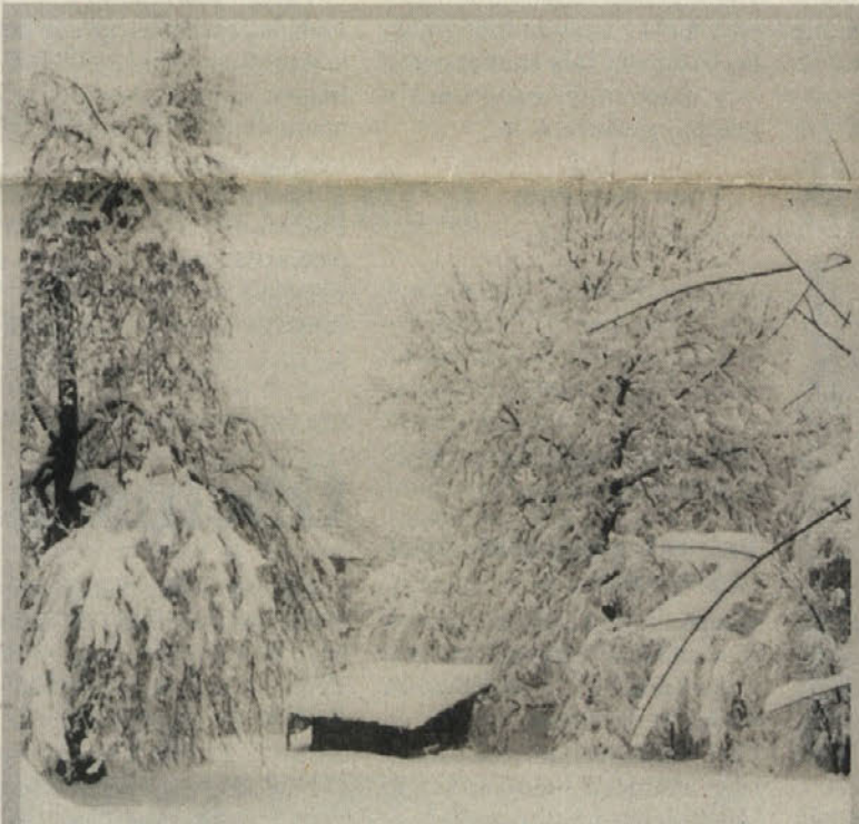
Zima, zima bela ... - letos je namedlo snega, kot že dolgo leta ne. Veselijo se predvsem otroci in hotelirji, šoferji pa čakajo na pomlad.