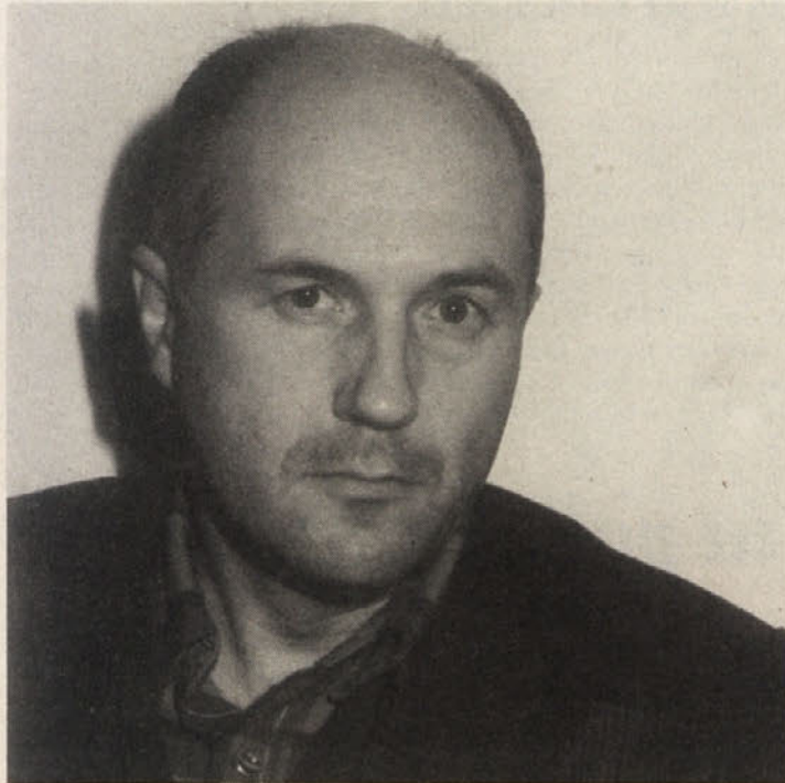
Avstrijski veleposlanik v Sarajevu dr. Zdravko Inzko

Dr. Inzko je bil izbran za veleposlanika že novembra lani, vest o imenovanju pa je prišla v javnost šele tik pred božičem. Odločitvi avstrijske vlade so botorovale predvsem Inzkove izkušnje ob njegovih doslednejših zadolžitvah, pri katerih so mu bile poverjene pomembne pionirske naloge, ki so zahtevale trdo delo, in dejstvo, da kot koroški Slovenec pozna jezik in kulturo Bosne. Svoje diplomatsko-menedžerske sposobnosti je Inzko dokazal med drugim kot diplomat v službi Združenih narodov v Mongoliji in v New Yorku, v Pragi, kjer