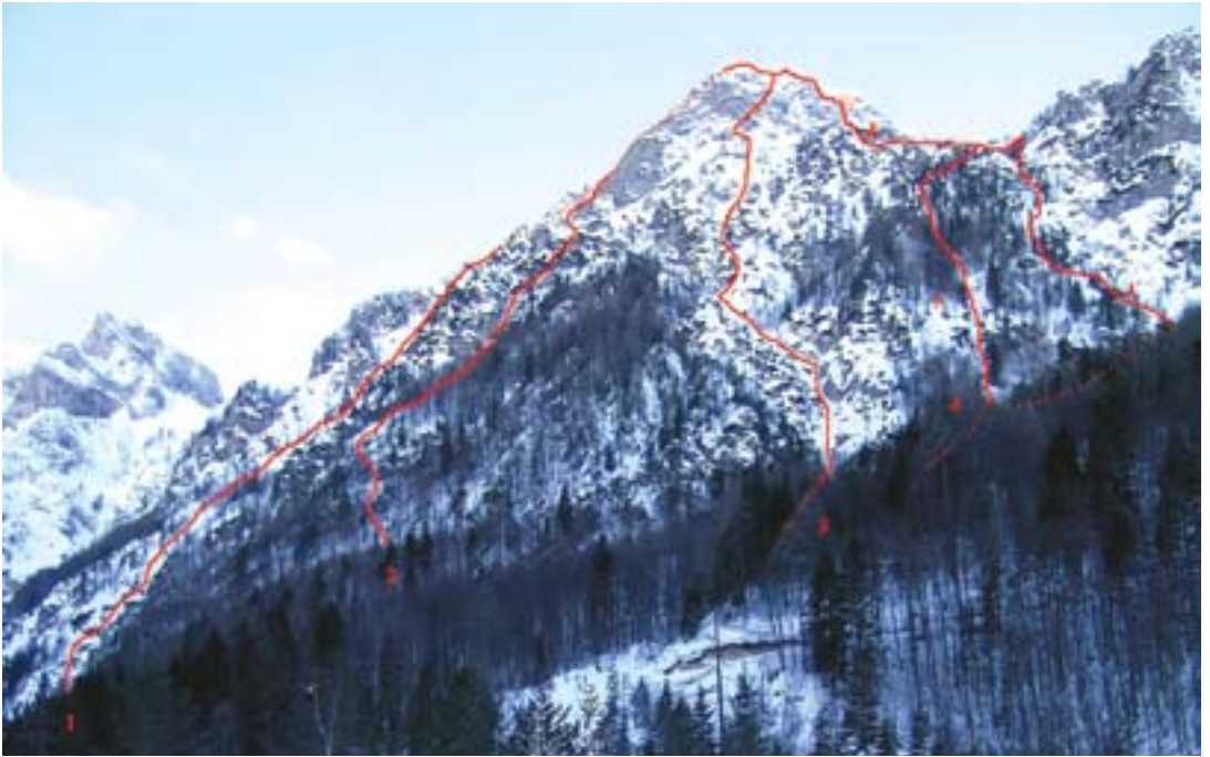
Smeri v Matkovi kopi: 1 Jugovzhodna grapa, 2 Leva grapa, 3 Centralna grapa, 4 Sestopna grapa, 5 Varianta sestopne grape

pasu. Še danes mi ni jasno, zakaj se tam ni utrgal plaz. Kot že dvakrat ta dan, smo se tudi tokrat lahko zahvalili srečnemu naključju. Sestop v dolino je potem bil le še sprehod.