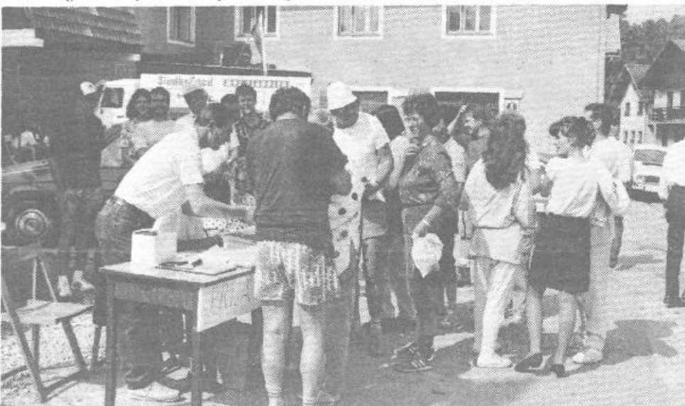
Udeleženci pohoda po kulturni poti na dan 6. junija

Zvedeli smo, da so odobrena denarna sredstva člani odbora namenili za asfaltiranje svojih nepomembnih uličic, ob katerih imajo svoje hiše.