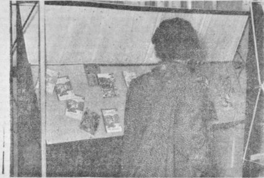
Z razstave mladinskega tiska v Celju

Naše knjižnice ne bi smele služiti samo za razvedrilo čitalcem, ampak bi morale biti kulturna potreba siehernega člana naše družbe. Zato pa bo treba pričeti z vzgojo našega bralca že pri najmlajših in bomo morali bolj resno razmišljati o ustanavljanju pionirskih knjižnic. Nujno pa je tudi, da v naših knjižnicah uvedemo urejeno službo pod vodstvom kvalificiranih knjižničarjev.