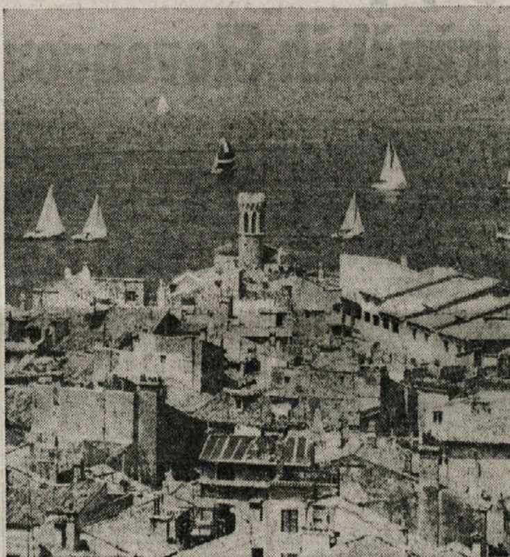
Piran — del starega mestnega jedra