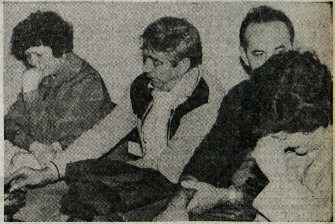
Za številne družine, ki so ostale brez strehe, se je križev pot šele začel

Obračun nesreče, ki je vzmetri- rila ves Trst, je torej tragičen, lako pa bi bil še veliko huji. Preosta- le člane starih družin, ki so živeli v porušeni krilu poslopja s šte- vilko 39, je namreč rešilo dejstvo, da se je stavba porušila šele nekaj minut po eksploziji in da so torej imeli dovolj časa za vratolomni beg po stopnišču, ki je sicer že bilo v plamenih. Težko je tudi domnevati, koliko smrtnih žrtev bi posejala eks- plozija v nočnih urah.