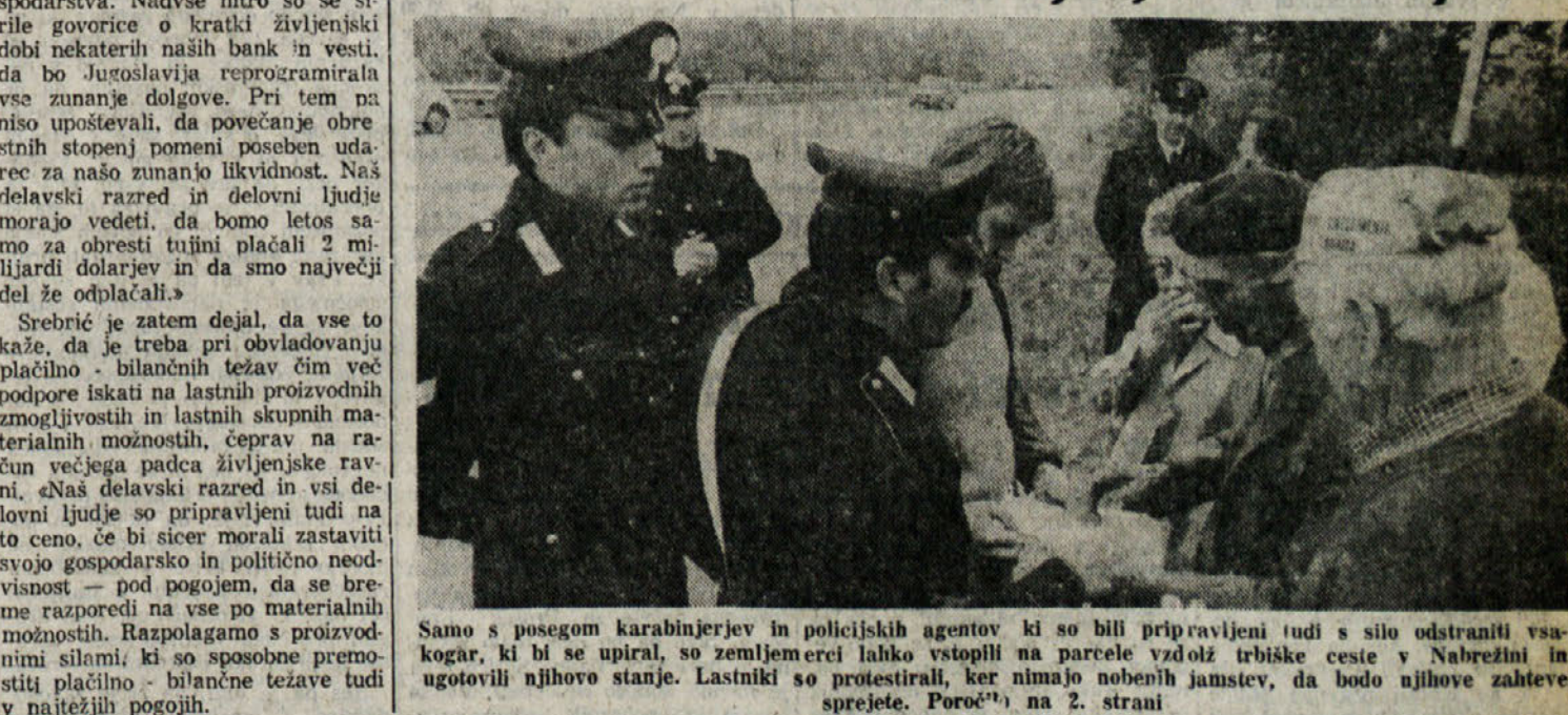
Samo s posegom karabinjerjev in policijskih agentov ki so bili pripravljivi tudi s silo odstraniti vsakogar, ki bi se upiral, so zemljemerci lahko vstopili na parcele vzdolž trbiške ceste v Nabrežini in ugotovili njihovo stanje. Lastniki so protestirali, ker nimajo nobenih jamstev, da bodo njihove zahteve sprejete. Poročila na 2. strani