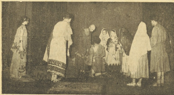
Prizor iz trilogije „Pavel iz Tarza“ (delo Gvida Manacorda), ki so ga vprizorili na proslavi Kristusa Kralja v Buenos Airesu

To nedeljo molimo drug za drugega: vsi izseljenci za vse izseljence! Molitev je močna vez med dušami, globoko seže in mnogo pomaga. Molitvena vez gre skozi božje Srce in prinaša milosti molivcu in vsem, za katere molimo. Kristjani te vezi ne smemo in nečemo zanemarjati ali podcenjevati. V raznih delih sveta, v zelo različnih razmerah živimo, smo malo v stiku med seboj, osebno se večinoma ne poznamo, pa je končno razumljivo, da pozabimo na tisoče svojih rojakov, ki so po svetu in so prav tako kakor mi: slovenski izseljenci. Molitev, vsaj na eno nedeljo opravljena izrecno za vse izseljence, nas zopet opozori, da smo del sorojakov in sotrpinov, razpršenih po vsej zemeljski obli.