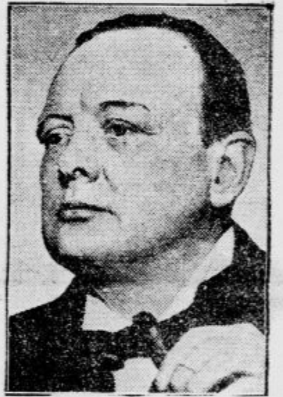
Winston Churchill, znani angleški politik in bivši zakladnik kancelar, ki ga je v New Yorku povozil neki avto in ga težko poškodoval