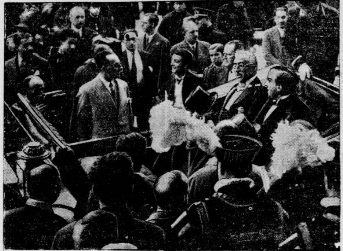
Novoizvoljeni predsednik španske republike Alcala Zamora (levo) v spremstvu zborničnega predsednika Basteira na poti v parlament, kjer je položil svečano prisego na ustavo