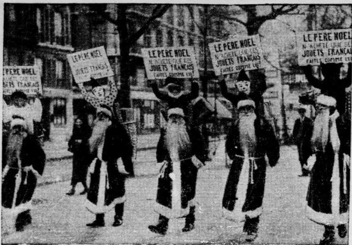
»Francozi, kupujte za Božič samo francoske igrače!«