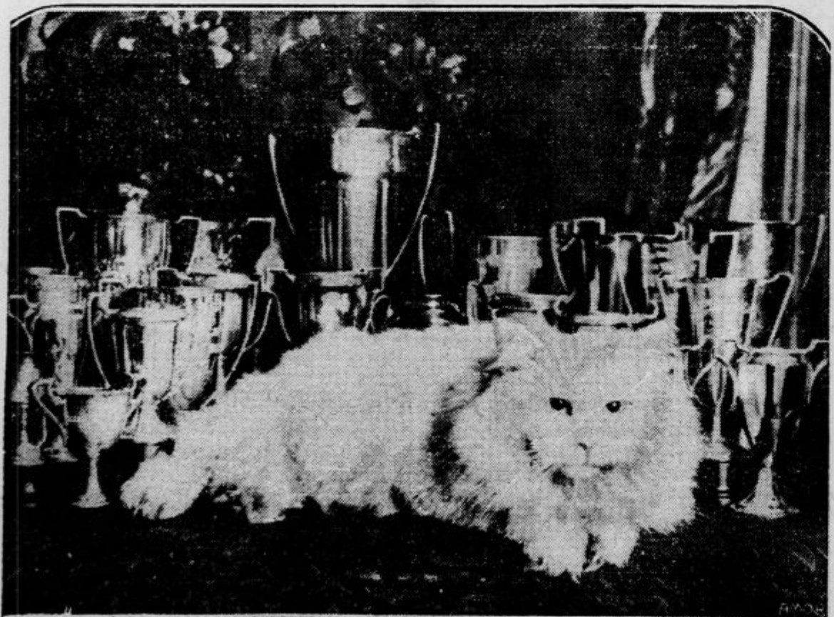
»Kralj vagabunde«, krasen perzijski maček, star 4 leta, je prejel prvo nagrado na razstavi v Wearbornu v državi Michigan (U. S. A.). številne kupe, ki jih vidimo za zmagovalcem, si je priboril na raznih razstavah, od kar živi