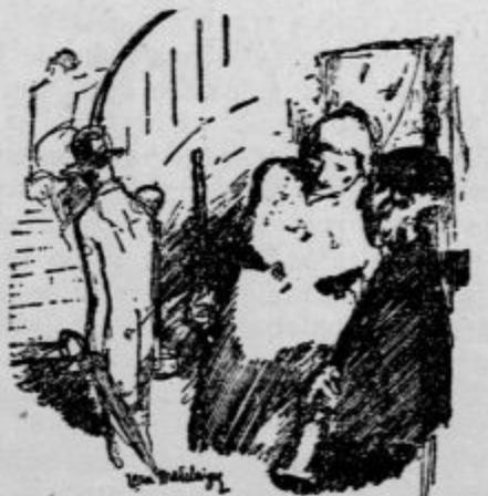
Novi časi »Ne moreš si misliti, kaj vse sem mu moral obljubiti, da sem ga dobil za najemnika!«