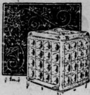
Cena Din 36.—