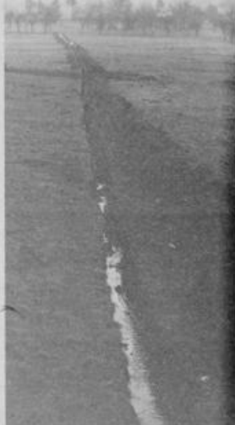
Pripravljeno za vodovod

Nastali položaj je posledica vedno večjega vpliva televizije in s tem manjšega obiska kinopredstav, vendar to še ni največje hudo, saj vsi vemo, da so to stvari prehodnega značaja. Bolj zaskrbiljujoče je nemogoče obnašanje nekaterih „ponežev“ ki med predvajanjem filma kadijo, se glasno pogovarjajo, hodijo sem in tja ter skratka ustvarjajo takšen nered, da marsikateri resen obiskovalec kina raje ostane doma in tako ohrani mirno kri in živce. Poleg tega, da bodo vse organizacije in društva pomagale prosvetnemu društvu obdržati kino-