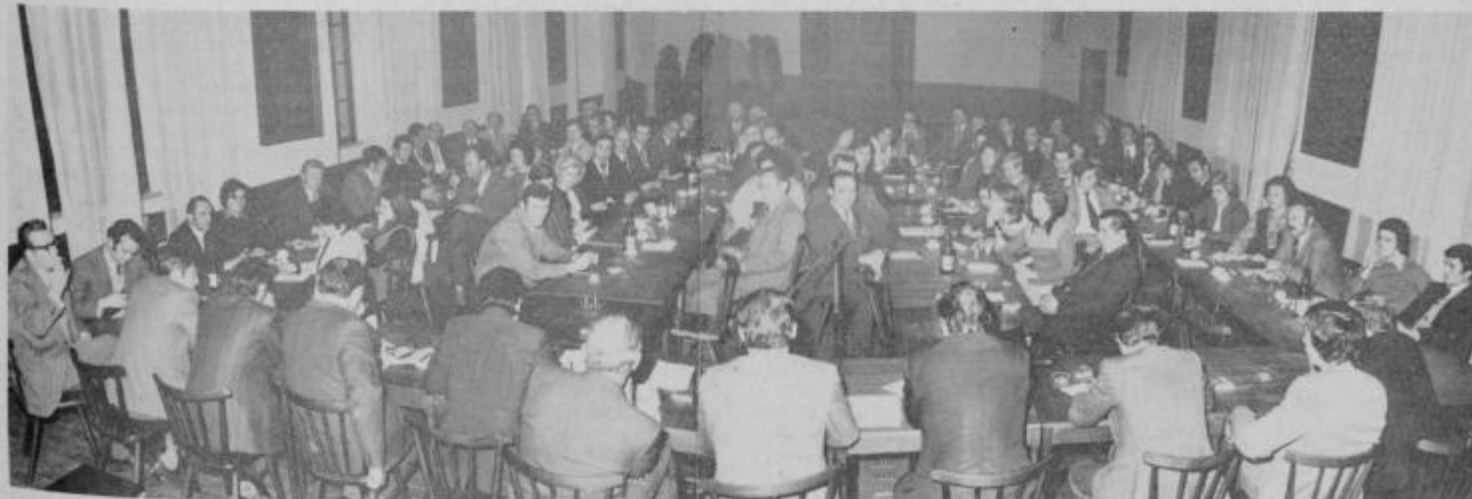
Udeleženci in predavatelji seminarja TOZD Panonija Ptuj, ki je bil 28., 29. in 30. januarja na Borlu