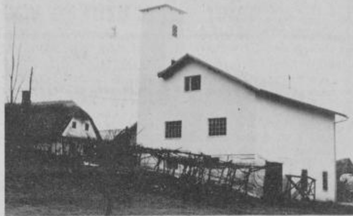
Severozahodna stran gasilskega doma v Markovcih.