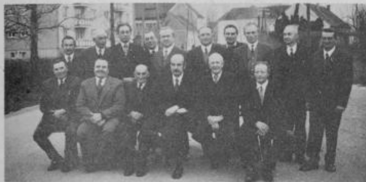
Slika v spomin na člane sveta KS Gorišnica.

povezavi z vsemi lokalnimi in tudi občinskimi činitelj storil vse, kar bo v njegovih močeh, da bo Gorišnica še dalje napredovala, da bo mladina rada ostajala v domačem kraju. Doma sei bo rezala pošteno zaslužen in dober kruh in da se bo tudi udeleževala na področjih dela, ki jih najbolj veseli s ciljem, da bi prizadevanja vsega prebivalstva v KS Gorišnica na vseh področjih dela rodila skupen uspeh. V nevarnih časih pa naj se pokaže, da so vsi prebivalci v KS Gorišnici kot en mož, ki se zaveda lepote in bogastve svoje domovine in da je ta zavest tudi zadoljuje, da bodo obvarovali njeno lepoto in bogastvo pred vsemi nevarnostmi. To je tudi naloga in dolžnost vsakega Slovenca in Jugoslovana, je pa tudi čast, ki jo pozna in priznava danes šimi svet jugoslovanskim narodom glede na