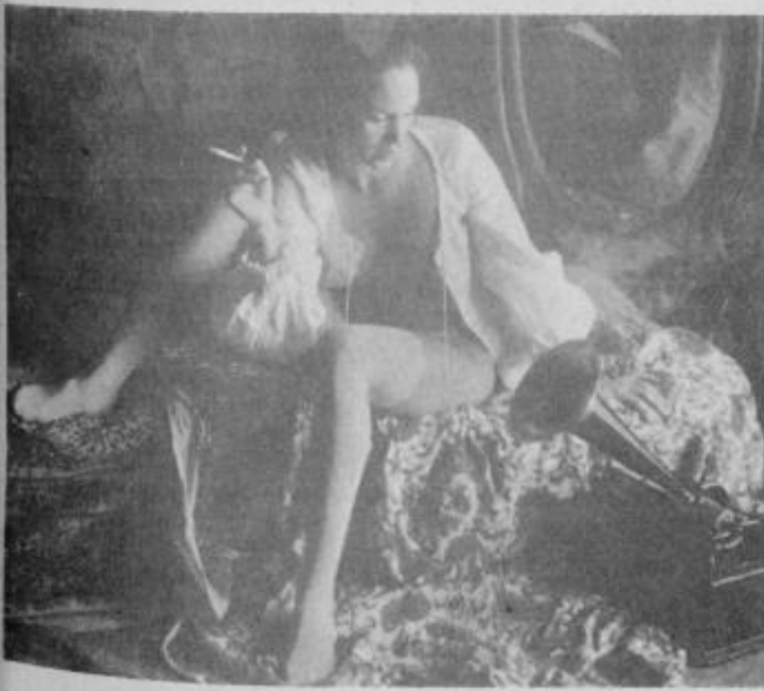
Površno oblečena s cigareto v roki je njuna prijateljica nemo zrla v gramofon, niti pogledala ju ni.