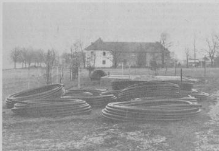
Pripravljene vodovodne cevi za vodovod na področju KS Ivanjkovci. V ozadju je poslopje žerovinskega združnega doma, kjer je tudi dvorana.