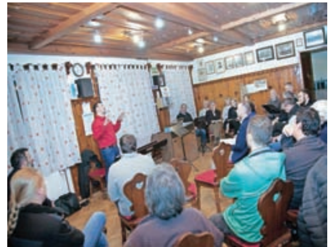
Na konferenci se je zbralo kakšnih dvajset predstavnikov kamniških kulturnih društev.