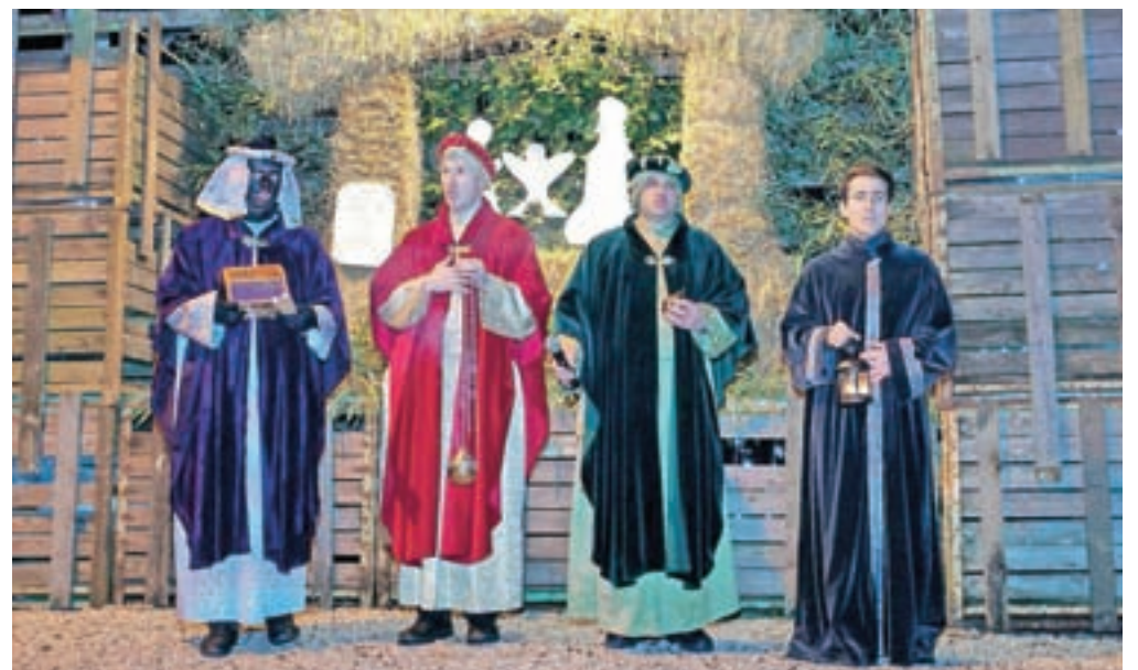
Trikraljevsko koledovanje pri Grošanovih jaslicah na Perovem