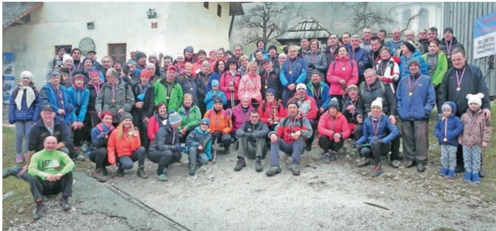
Ljubiteljev Sv. Primoža je iz leta v leto več.