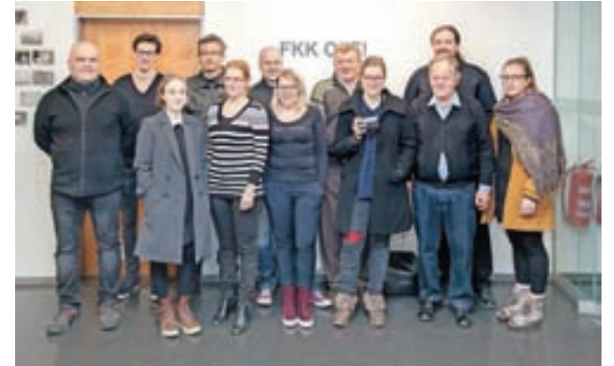
Sodelujoči člani na razstavi FKK OFF!

V kamniškem fotografskem društvu sicer aktivno deluje od 15 do dvajset članov, ki jim je poleg temnice na voljo tudi dobro opremljen studio, v povezavi s Knjižnico Franceta Balantiča Kamnik pa nekaj sto enot knjižnega gradiva s področja fotografije. Vsako leto pripravijo več delavnic, predavanj in organizirajo ekskurzije po Sloveniji in tudi v tujino. Tudi letos bodo sledili začrtanim smernicam in ponovno sodelovali na bienalu sodobne fotografije Fotonični trenutki, ki ga organizira Center za sodobno fotografijo Photon v Ljubljani.