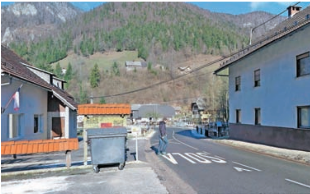
Cesta pri Podružnični šoli Gozd nima prehoda za pešce, zato je prečkanje na tem delu za pešce zelo nevarno.

Ali gre zares za zapostavljanje krajanov doline Črne, smo povprašali tudi predsednika Krajevne skupnosti