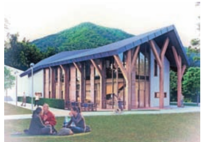
Nov objekt bo namenjen tako žičniški kot turistično-gostinski dejavnosti.

»Glede leta 2017 lahko povem, da je bilo leto za nas zelo dobro. Zabeležili smo rekordno število potnikov na nihalki, in sicer skoraj 70 tisoč (66.232), ter rekordni dobiček. Ustvarili smo za več kot 1,3 milijona evrov prihodkov. Od tega znaša čisti dobiček okoli 300 tisoč evrov. Točne podatke bomo imeli v naslednjih dneh,« še pravi direktor, ki letos poleg začetka gradnje novega objekta pri spodnji postaji nihalka namerava izpeljati še nekaj naložb. Med drugimi bodo investirali v zame-