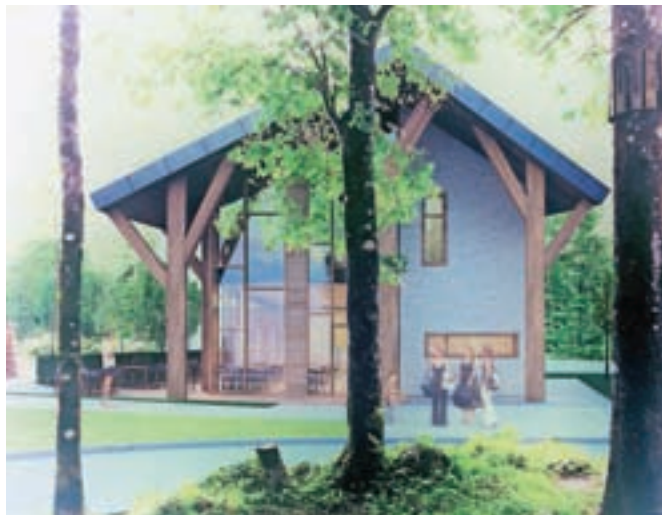
Kdaj naj bi se gradnja začela, še ni znano, saj mora družba Velika planina najprej dobiti gradbeno dovoljenje.