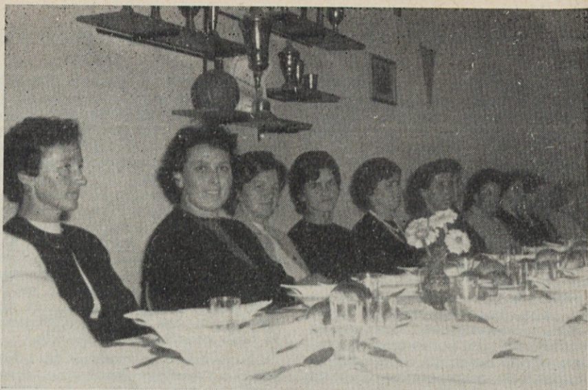
Dvajsetletniki, gostje naših samoupravnih organov