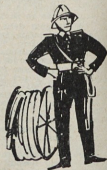
Tovarno smo čuvali (in očuvali) pred požarom