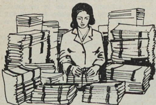
Izdelke smo (ročno) opremili in