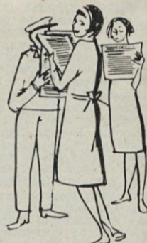
in o vsem tem pisali v Konoplani

Članom kolektiva Induplati in vsem bralcem Konoplana