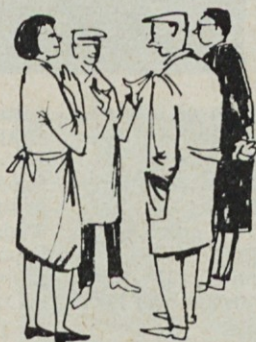
med delom preveč razpravljali