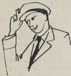
Voščili smo si srečno Novo leto