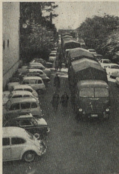
Cestna vozila so pripeljala nove stroje