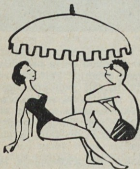
Dopuste smo »solidno« preživelii ter