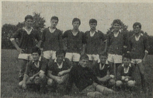
Mladinsko moštvo Induplati

Zvedeli smo, da je tekmovalna komisija NPL tekmo INDUPLATI : MEDVODE, ki se je končala z re-