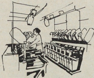
ter pričeli z delom na novejših