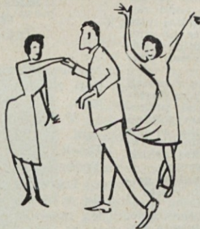
Bili smo (in smo še) radi dobre volje