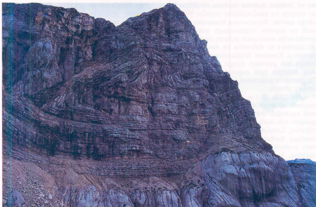
Sl. 2. Skladnati dachsteinski apnenec Kanjavca (2568).