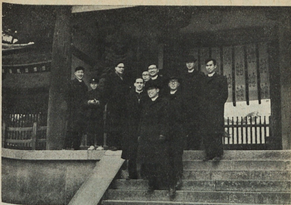
Skupina japonskih bogoslovcev, med katerimi sta tudi dva naša vzdrževanca.

nov duhovnik domačin je v misijonih za svoj rod ali narod nov srednik med Bogom in dušami sorojakov, nov oznanjevalec blagovesti, veselega oznanila v stiskah vsakdanjega življenja. Sv. Vincencij je svojim duhovnim sinovom lazaristom dal za geslo: „Poslal me je oznanjevat evangelij ubogim.“ Pomagati misijonskim deželam do čim več svetih, intelektualno temeljito formiranih, gorečih, nesebičnih domačih duhovnikov, je dandanes najnujnejša potreba časa in nedopovedljivo velikodušno dobro delo, katerega važnost in zasluženje bo sodelujočim v celoti doumljivo šele v večnosti.