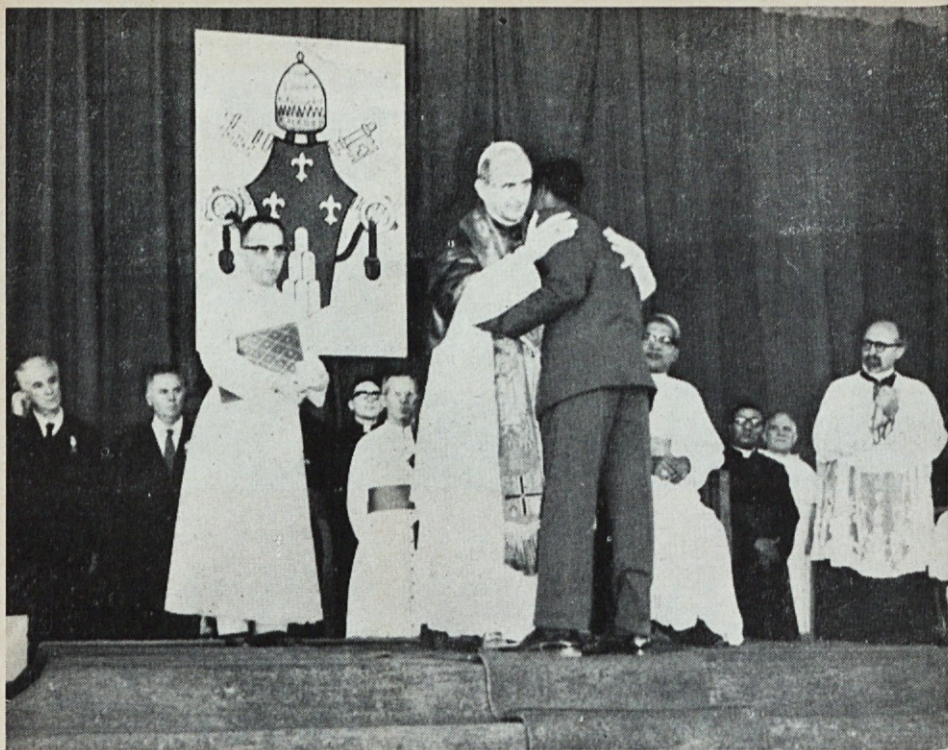
Sveti oče Pavel VI. objema na bombayskem evharističnem kongresu zastopnika indijskih študentov. Spodaj: Papežev legat kardinal Agagianan med slavnostno mašo, posvečujoč na desetisoče hostij za sv. obhajilo.