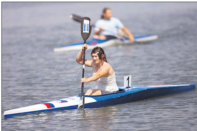
Utrinek s tekmovanja kajakov in kanujev na Ptujem jezeru.