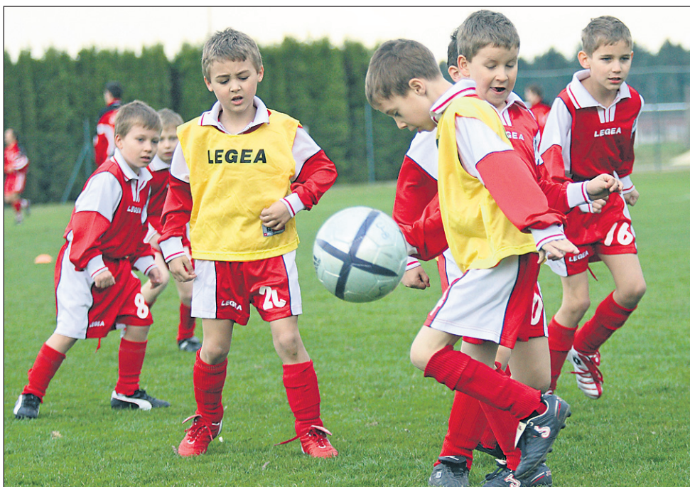
V Kidričevem mladim nogometašem nudijo odlične pogoje za delo.