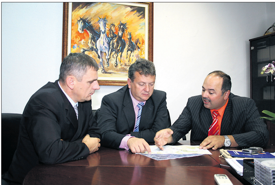
Pogovori v prostorih občine Lenart