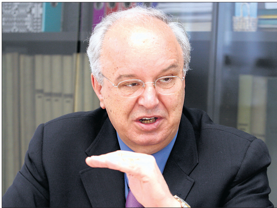
Dr. Andrej Bajuk, finančni minister RS in predsednik N.Si: »Zdajšnje stanje v državi spominja na vroče poletje 2000, ko se tudi ni več vedelo, do kod sega normalen politični dialog, kaj pa je že nekontrolirana predvolilna borba.«

Slovenski gospodarski kazalci so v tem trenutku izredno ugodni: nizka inflacija, visoka gospodarska rast (7,2 odstotka), ena najvišjih trenutno v Evropi, relativno nizka brezposelnost. K temu so predvsem prispevale stabilne razmere gospodarstvu naklonjenega okolja, v katerem ni več neznank, kjer podjetniki vedo, kaj jih čaka, tudi vstop v evroobmočje je prispeval k odpravi negotovosti, ki je naj-