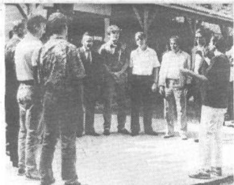
Ubrano so zapeli pevci iškovarskega Orfeja in s pesmijo dali srečanju vedrejši ton.

Iška vas – pa prejme Blagajano najboljših. To je