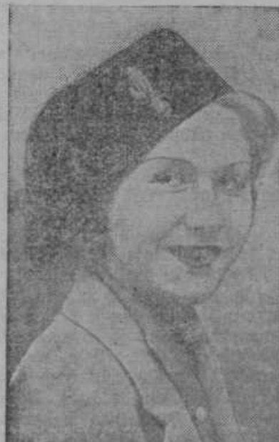
Po Hitlerjevem obisku v Rimu bodo nosile Nemke namesto klobuka fašistične čepice.

Draginja raste. Mesarji so podražili meso, za- radi kmeta pravijo, kar za 2 din pri 1 kg. Zdaj bomo morali pa kmetje podražiti živino zaradi mesarjev vsaj za 1 din pri 1 kg, da ne bi kdo me- sarjem delal kakih očitkov!