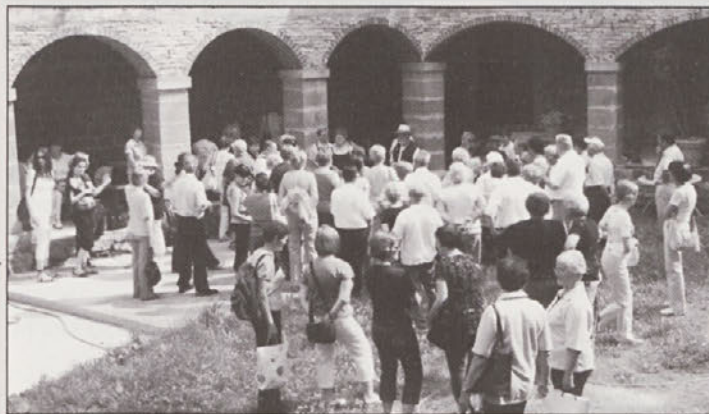
Pevci iz Šibenika so si ogledali tudi mirski grad.

V začetku febr. letos smo gostovali v Šibeniku. Ker ženski zbor PREŠERNOVKE slovenskega KUD Dr. France Prešeren iz Šibenika prihaja na Tabor Šentvid (letos je bil 22. junija), smo