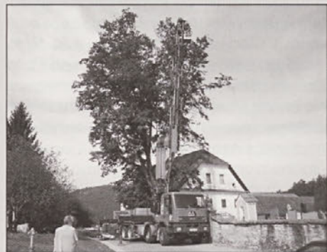
Delo je bilo nevarno in zahtevno, a lipa je potem dobila manjšo krošnjo, ki ne ogroža več.