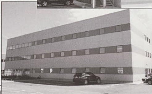
Jeklena konstrukcija proizvodnega objekta