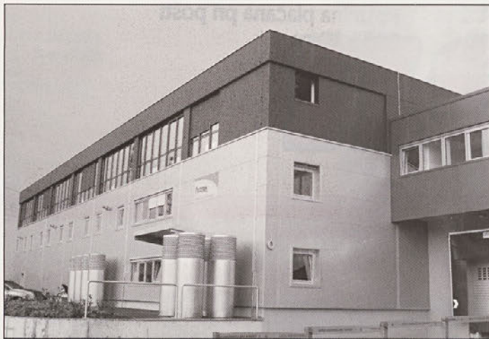
Poslovni objekt v Ljubljani