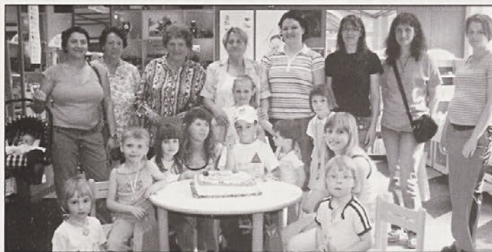
Malčki, mamice, babice, knjižničarke in pravljica Štaša

(Knjižnica Pavla Golie otrokom razdelila nagrade)