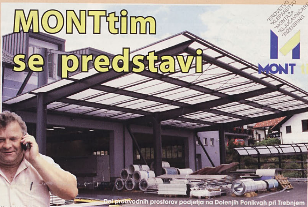
Del proizvodnih prostorov podjetja na Dolenjih Ponikvah pri Trebnjem

*KROVSTVO *KLEPARSTVO *MONTAŽA *KLJUČNIČARSTVO *INŽENIRING