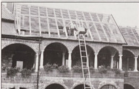
Pokrivanje južnega dela mirskega gradu je bilo nevarno in zahtevno.

V letu 1942 je moral spet pasti kot žrtev vojnih viher, ki so divjale na območju njegovega podnožja. Zgodovinska naloga gradu je preživeva, zato po vojni ni bilo izgledov, da bi zopet »ozelenel«. Pa vendar se je dvignil iz vojnih požganin in danes ga spet gledamo takega, kakršnega so gledali tisočletja naši predniki. Dobil je spet nalogo, tokrat zgodovinsko, da pripoveduje ne samo o sebi, ampak tudi o dogodkih, ki so se odvijali na njem in v njegovem podnožju.