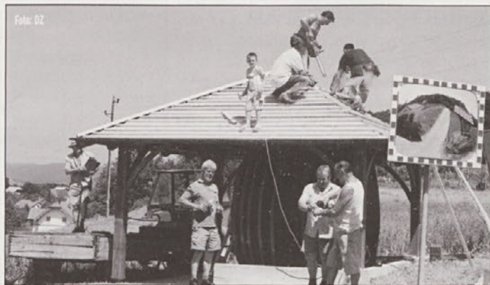
Vinogradniki so pri kapelici na Štanu razstavili skrbno obnovljen sod in ga proti vremenskim nepravilnostem zaščitili z lično izdelano streho. Bravo!

Mesec dni kasneje je društvo organiziralo ocenjevanje vin letnika 2007. Zbrali so 83 vzorcev vin. Rdečih vin je bilo 53, belih pa 30. Šestčlanska strokovna komisija ni imela lahkega dela, saj je morala oceniti kar 11 vrst vin. Predsednik komisije je ob zaključku ocenjevanja podal tudi zaključno splošno oceno, ki je bila pozitivna. Poudaril je, da med izločenimi vzorci ni bilo nobenega, ki bi kazal znake bolezenskega stanja, ki nastane kot posledica delovanja neželenih mikroorganizmov (ocetnokislinske bakterije, mlečnokislinske bakterije, divje kvasov-