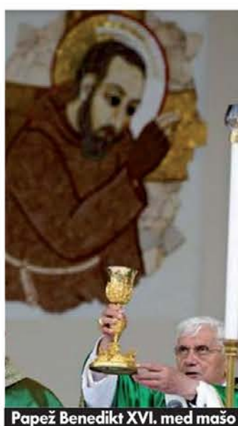
Papež Benedikt XVI. med mašo

Tik pred koncem pastirskega obiska je papež stopil v novo kriptu, kjer bo od jeseni dalje počivalo svetnikovo truplo in ki jo je z mo-