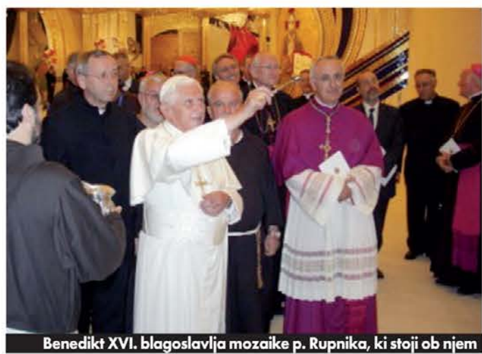
Benedikt XVI. blagoslovja mozaike p. Rupnika, ki stoji ob njem