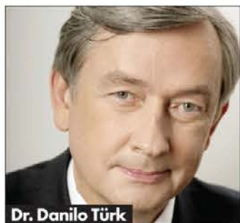
Dr. Danilo Türk

Drugi domnevno največji tajkun, Igor Bavčar, pa še zmeraj vztraja