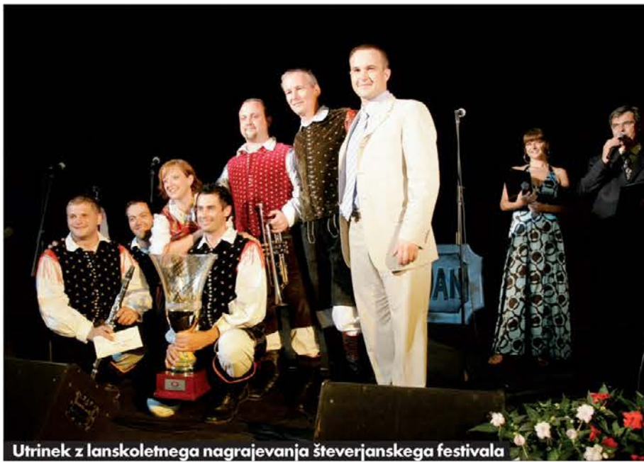
Utrinek z lanskoletnega nagrajevanja števerjanskega festivala

krepko narašča. Prvi dan Festivala se bo pričel v petek, 3. julija, ob 20.30, drugi tekmovalni večer bo v soboto, 4. julija, prav tako ob 20.30. Finalni del Festivala, ki