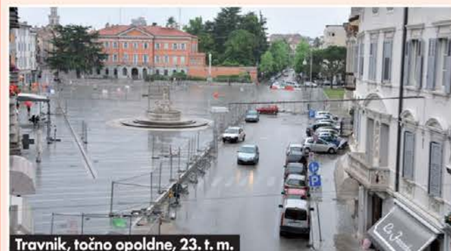
Travnik, točno opoldne, 23. t. m.

Že večkrat smo pisali, kako globoko rano je zarezala mestu odločitev goriške občinske uprave, da prenovi Travnik in ob prenovitvi tudi za vedno zapre predor, ki je povezoval mestno jedro Gorice z zaledjem mesta. Pa ni zaleglo in sedanja slika Travnika in mesta je porazna. Mesto dejansko umira na vseh ravneh, na gospodarskem, trgovskem in tudi na demografskem področju, Travnik pa je zaradi znane zaustavitve obnovitvenih del podoben živemu mrtvaku. Ljudje