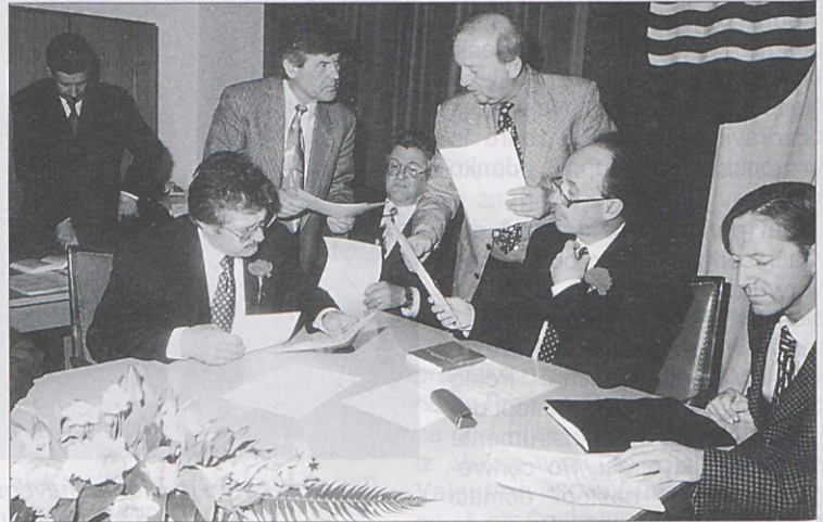
Prva seja občinskega sveta v Škocijanu je bila zelo turbulentna. Vzrok je bil, da SPÖ ni bila zadovoljna z razdelitvijo referatov.