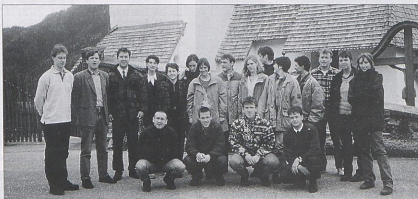
Na Obirskem so si študentje ogledali tudi farno cerkev.