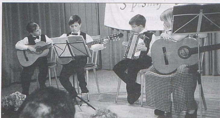
Mladi učenci Glasbene šole so prav tako zaigrali na svoje instrumente.