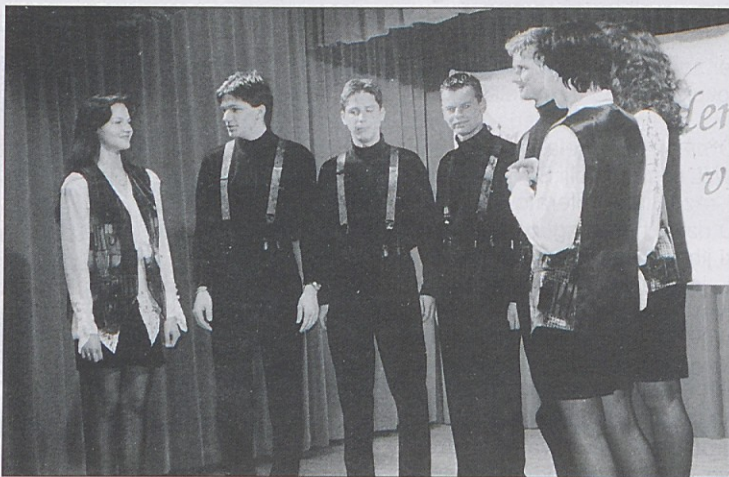
Občinstvo je izredno navdušila vokalna skupina VOX iz Pliberka in okolice.