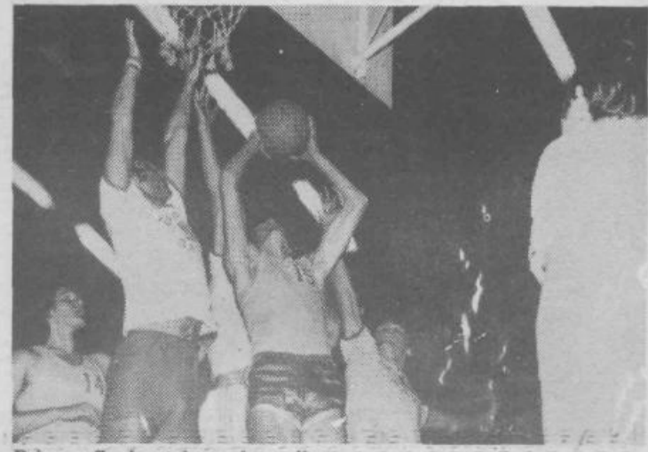
Priloz s finalne tekme gimnazijcev

SPOZNAVAJ DOMOVINO IN SE BOLJ JO BOŠ LJUBIL! VINKO PINTARIČ