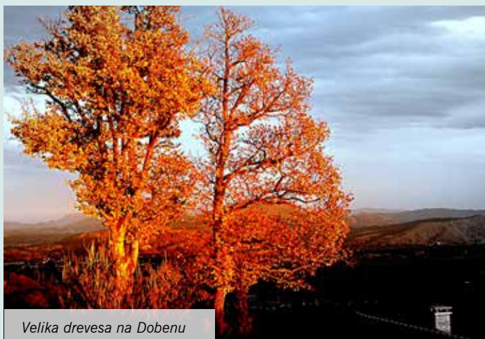
Velika drevesa na Dobenu