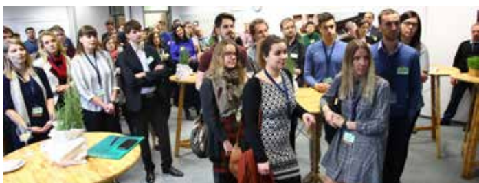
Prvih dveh zajtrkov se je udeležilo več kot 150 slovenskih strokovnjakov iz tujine, zaposlitev jih je do zdaj dobilo petnajst

V Leku v Mengšu so 3. januarja pripravili že tretji Novartisov karierni zajtrk za visoko izobražene strokovnjake naravoslovnih znanosti, ki delajo ali študirajo v tujini. Projekt Novartisov karierni zajtrk je namenjen spodbujanju vračanja slovenskih strokovnjakov naravoslovja v domače okolje in je novembra lani prejel tudi priznanje za najbolj inovativno prakso pri razvoju kadrov, ki jo podeljuje Planet GV. Dogodek poteka v sodelovanju z Javnim štipendijskim, razvojnim, invalidskim in preživninskim skladom Republike Slovenije ter Društvom v tujini izobraženih Slovencev Vtis.