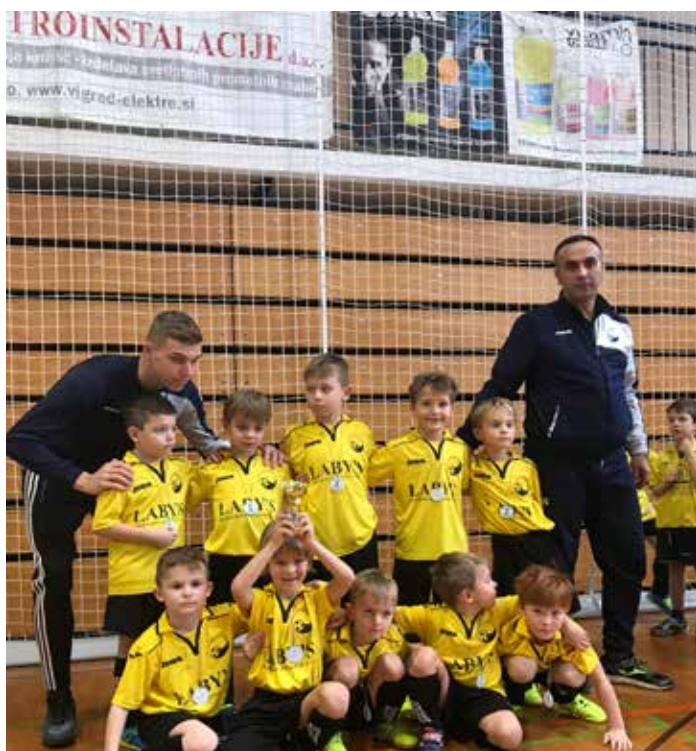
Mladi nadobudni nogometaši so pred številnimi navijači, starši, znanci prikazali svoje nogometne veščine