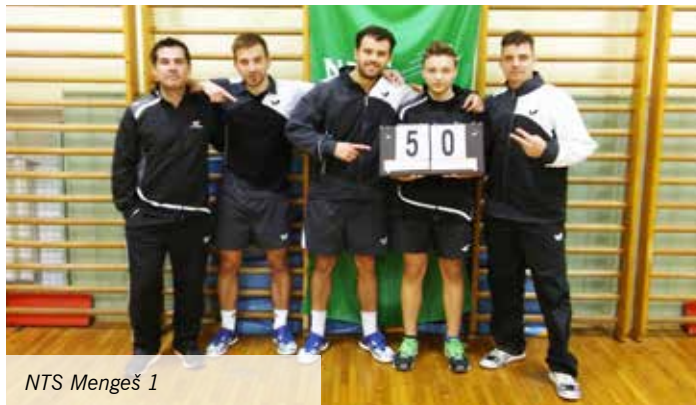
NTS Mengeš 1