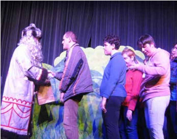
Družabno druženje z dedkom Mrzom