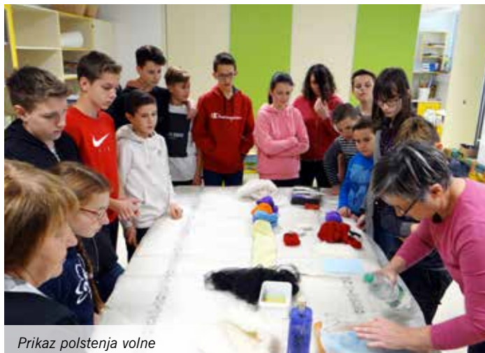
Prikaz polstenja volne