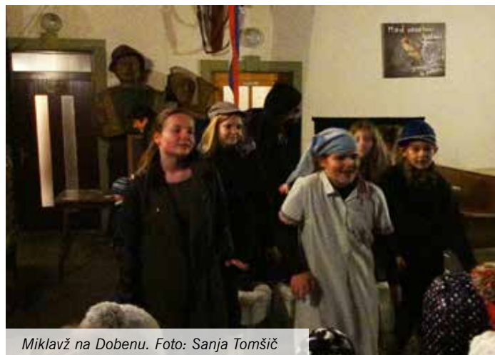
Miklavž na Dobenu.