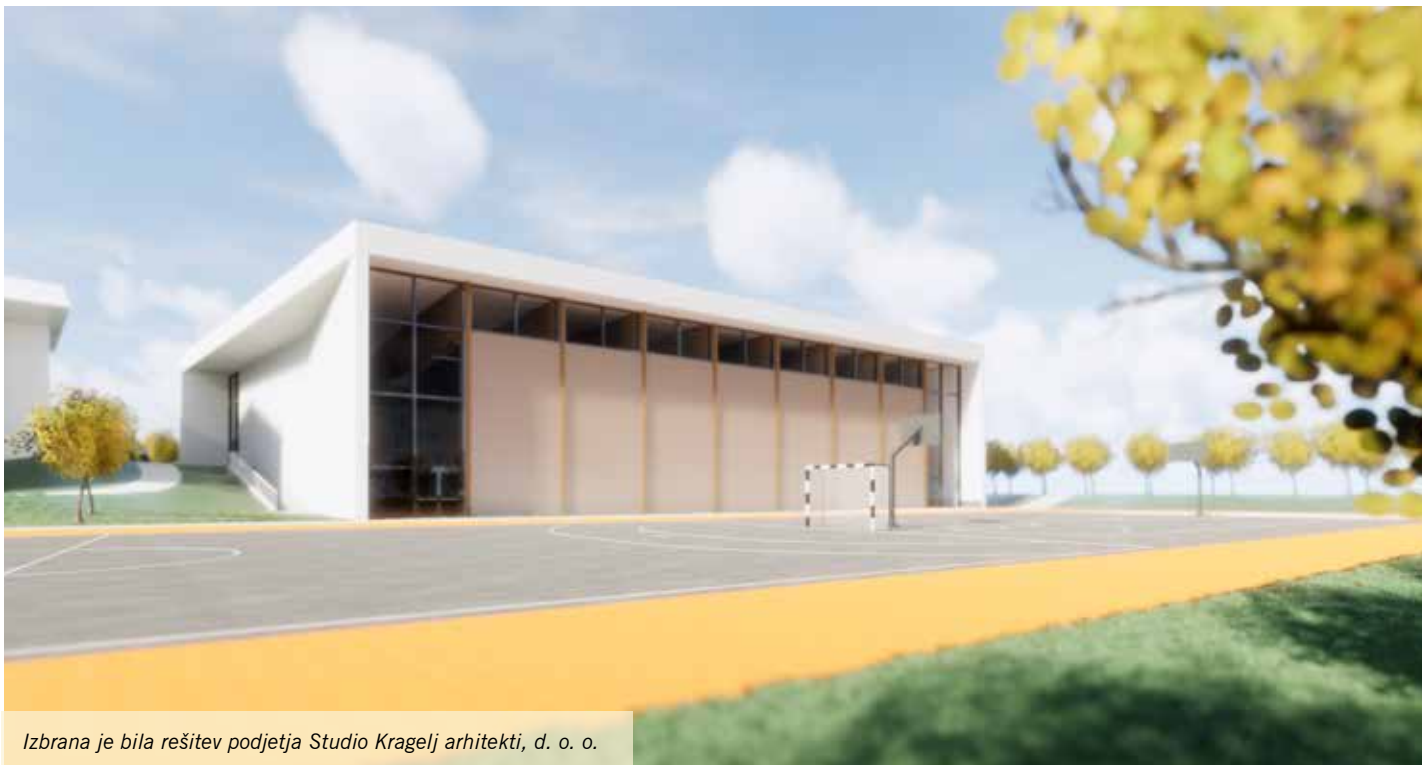
Izbrana je bila rešitev podjetja Studio Kragelj arhitekti, d. o. o.

Z ureditvijo novih prostorov za šolsko knjižnico bo poleg lažje izposoje knjig zagotovljeno več prostora za organizacijo različnih aktivnosti in razstav povezanih s knjigami, branjem in drugimi vsebinami, ki so sedaj namenjene zelo omejenemu številu učenk in učencev. Prav tako pomembni so tudi kabineti za pedagoške in strokovne delavce, saj kakovostna organizacija pouka zahteva vse več učnih priprav ter individualnih obravnav učenk in učencev.