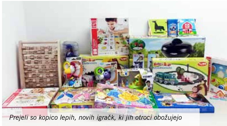
Prejeli so kopico lepih, novih igračk, ki jih otroci obožujejo