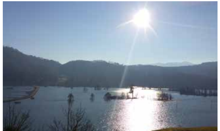
Pot, ki ti jo kažem, ni drugačna od tiste, po kateri te vodi tvoja narava