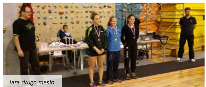
Tara drugo mesto