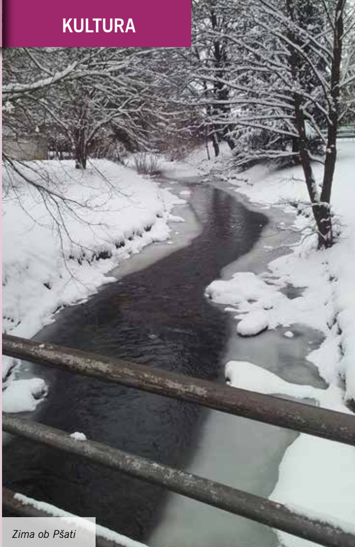
Zima ob Pšati