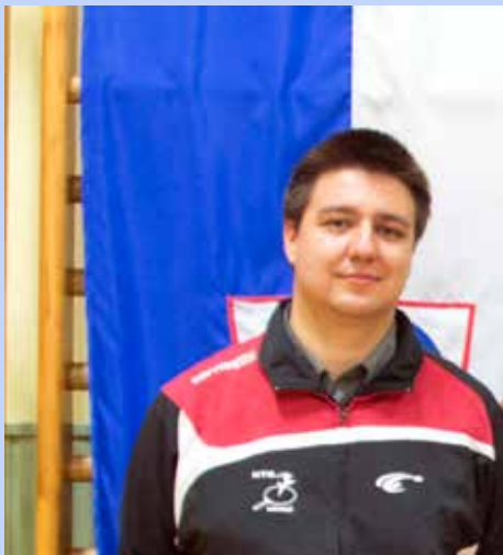
Z delom v društvu se je spoznaval tudi kot vaditelj športne rekreacije

Za vse športe so pomembne tako prirojene kot tudi pridobljene motorične sposobnosti. Z redno vadbo si motorične sposobnosti lahko izboljšaš, predvsem moč, vzdržljivost in hitrost. Redna vadba v mladosti pripomore tudi k boljšemu planiranju časa za učenje ter prostega časa, ki ga je treba porazdeliti med časom za šolo in časom za treninge. Šport ti da tudi disciplino, vztrajnost in potrpežljivost. Vse to ti pomaga tudi pozneje v življenju, predvsem če si zelo zaposlen, saj si znaš pravilno organizirati prosti čas. Vsekakor pa se pri športu stkejo tudi prijateljstva, saj se s soigralci, s katerimi treniraš, redno videvaš in tako drugače skoraj tudi ne gre, kot da vsi delujemo kot enovita skupina. Spoznaš se tudi s tekmovalci iz drugih klubov, s katerimi se redno srečuješ na vseh tekmovanjih.