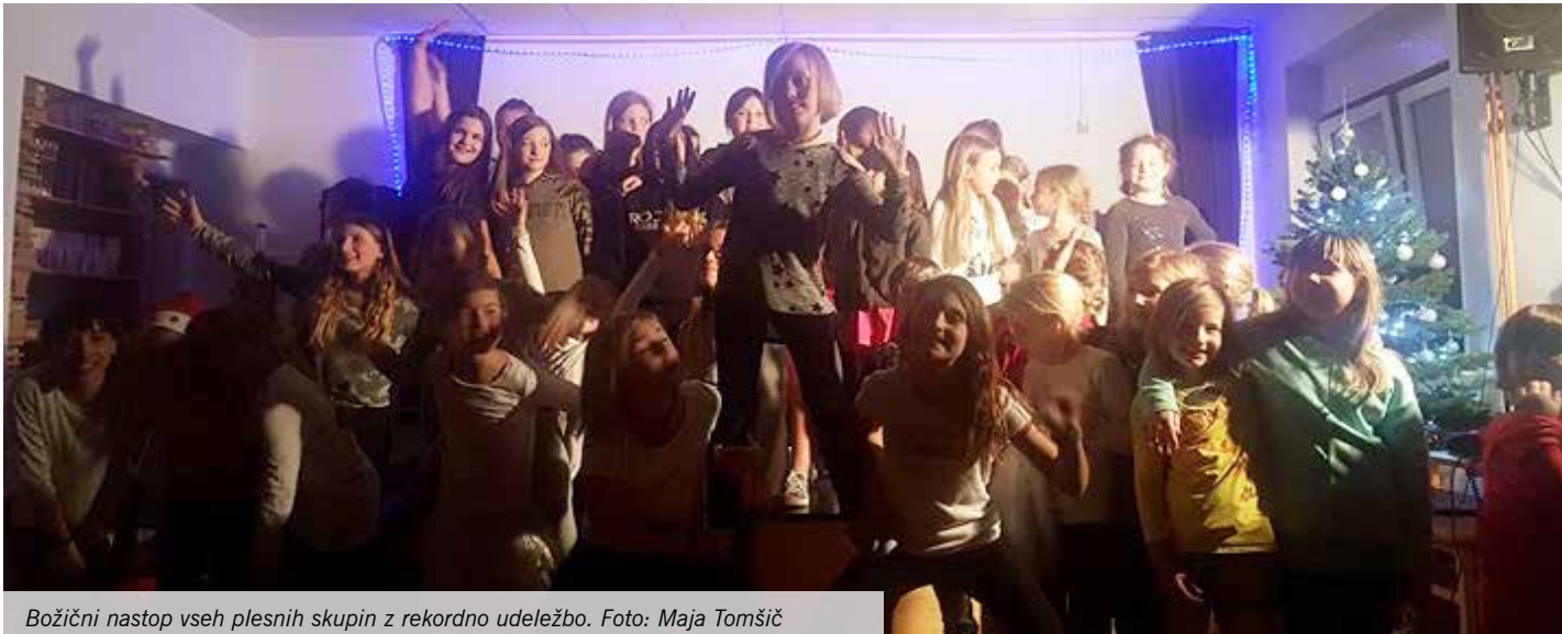
Božični nastop vseh plesnih skupin z rekordno udeležbo.