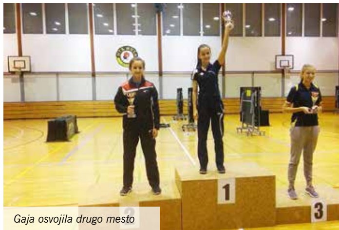
Gaja osvojila drugo mesto