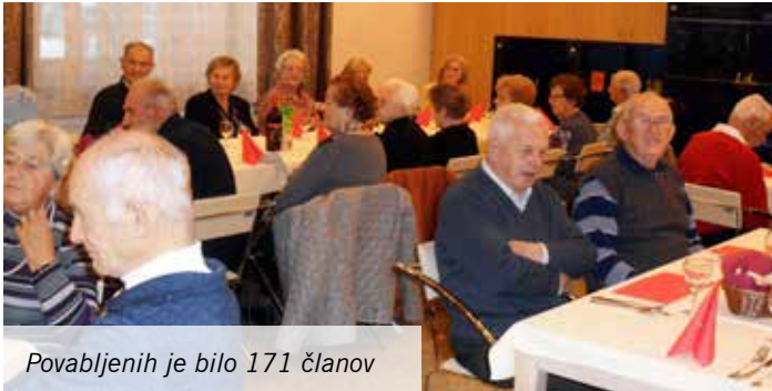
Povabljenih je bilo 171 članov

Društvo upokojencev Mengeš je 12. decembra 2017 organiziralo tradicionalno srečanje svojih članov starih 80 let in več. Srečanje je potekalo v posebej praznično okrašenem prostoru v Domu počitka Mengeš. Povabljenih je bilo 171 naših članov, ki so dosegli to visoko starost, srečanja pa se jih je udeležilo kar lepo število, kljub letom in različnim boleznim.