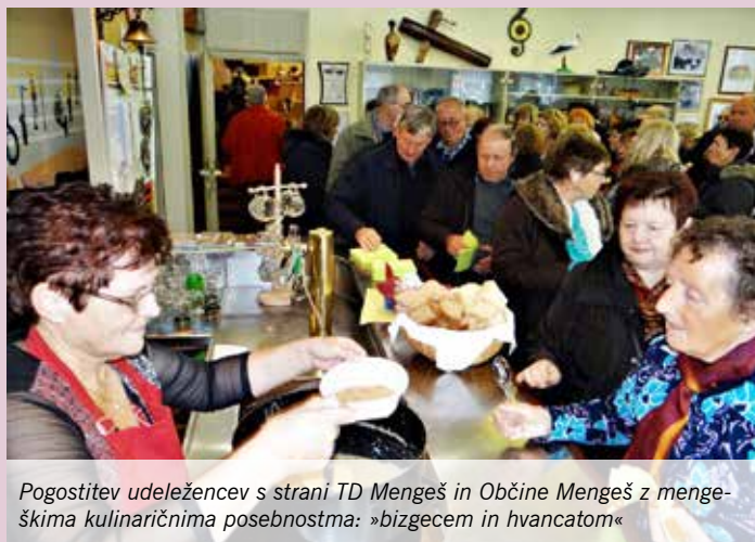
Pogostitev udeležencev s strani TD Mengeš in Občine Mengeš z menceškima kulinaricnima posebnostma: »bizgecem in hvancatom«

Ob koncu dneva smo bili organizatorji pohvaljeni in sledil je še ogled Mengša v praznični podobi, ki pa ga je skalil močan naliv, tako da so si ga gostje ogledali kar z avtobusnih sedežev. Zaklicali smo še: nasvidenje Koper in srečno pot domov! Se še kdaj vidimo na njihovem koncu!