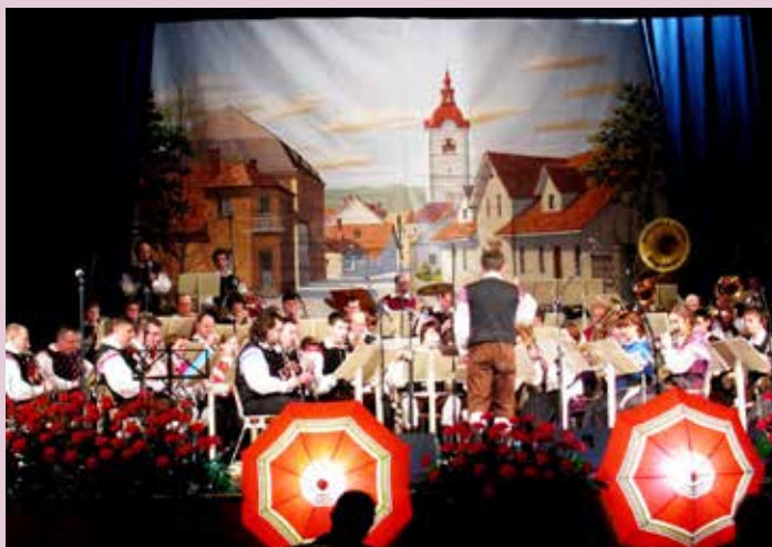
Narodno-zabavna prireditev Pod mengeško marelo bo tudi tokrat postregla z zanimivim programom

Besedilo: Maja Keržič