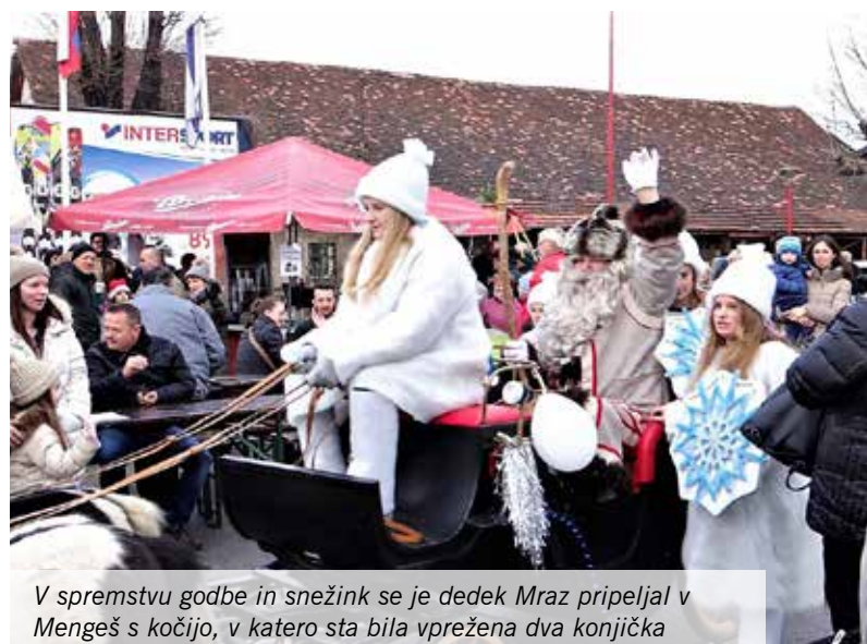
V spremstvu godbe in snežink se je dedek Mraz pripeljal v Mengeš s kočijo, v katero sta bila vprežena dva konjička