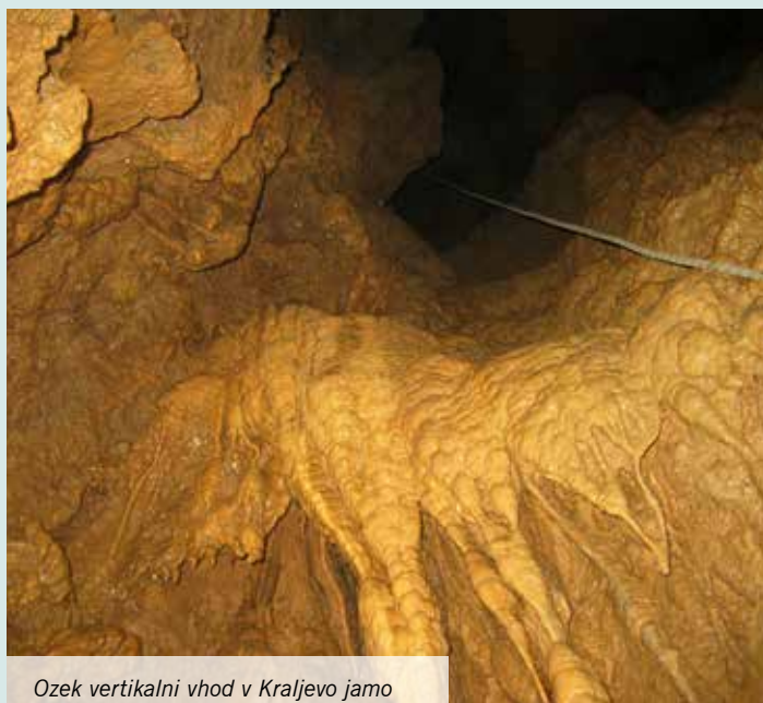
Ozek vertikalni vhod v Kraljevo jama