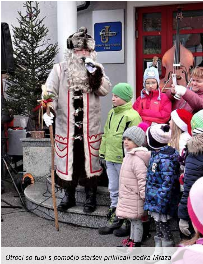
Otroci so tudi s pomočjo staršev priklicali dedka Mraza

Vsako leto, na potovanju okrog sveta, pokuka v vse skrivne koticke in vidi, da ni nikoli enako, kot je bilo lani ali še leto pred tem. Življenje se nenehno spreminja in lepo je, da prinaša tudi radostne trenutke.