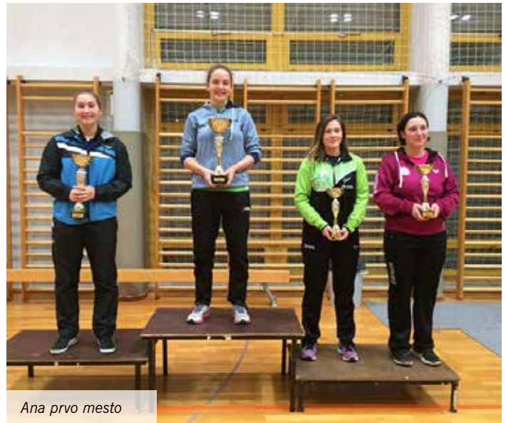
Ana prvo mesto