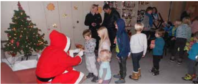
Vsak otrok je dobil darilo in priložnost, da poklepeta z Božičkom

V petek, 22. decembra, je bilo v Gasilskem domu Topole veselo, toplo in glasno ... Božiček nam je namreč že sredi decembra prišepnil, da so bili otroci v Topolah tako pridni, da jih bo prišel obiskat.