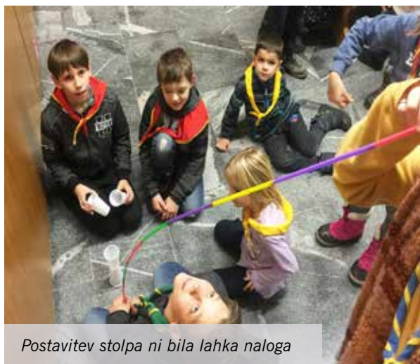
Postavitev stolpa ni bila lahka naloga