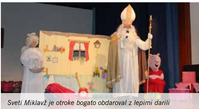
Sveti Miklavž je otroke bogato obdaroval z lepimi darili

Rotary klub Domžale je v sodelovanju z Občino Lukovica in Centrom za socialno delo Domžale tudi letos organiziral Miklavžev večer v Kulturnem domu Janka Kersnika v Lukovici. Večer je tradicionalno namenjen otrokom iz rejniških družin občin Lukovica, Moravče, Domžale, Mengeš in Trzin.