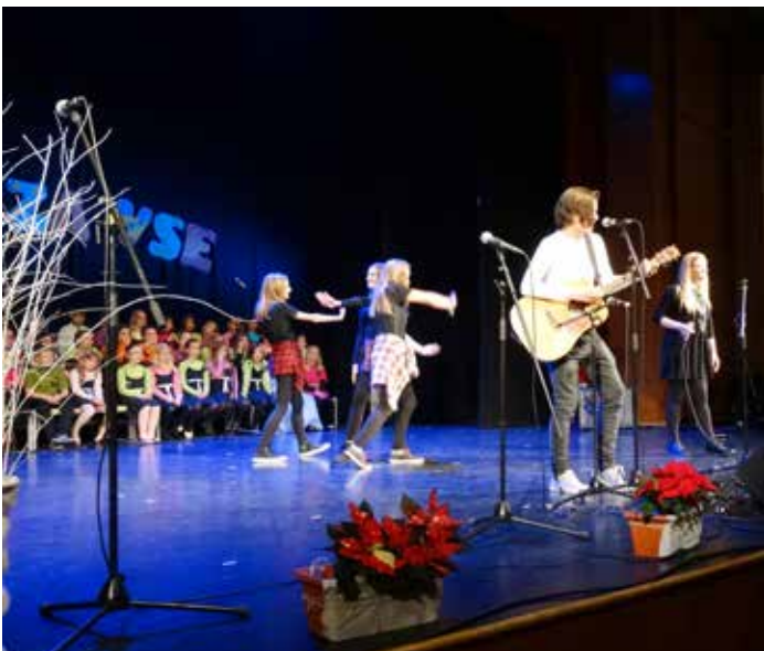
Nastop na Sonce za vse.

Praznične decembrske dni so vse plesne skupine iz AIA – Mladinskega centra Mengeš preživljale pridno in aktivno. S svojimi plesnimi točkami so izvedle kar pet nastopov, obarvanih v božičnem duhu in z njimi razveseljevale otroke, ki so se veselili težko pričakovanih božično-novoletnih počitnic.