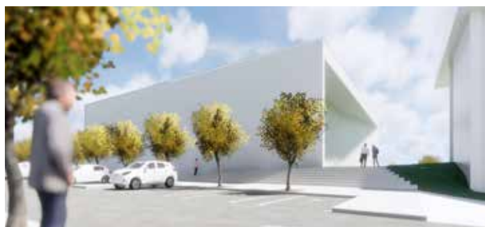
Parkovnim in rekreacijskim površinam so prilagojeni tudi materiali in zunanji videz objekta