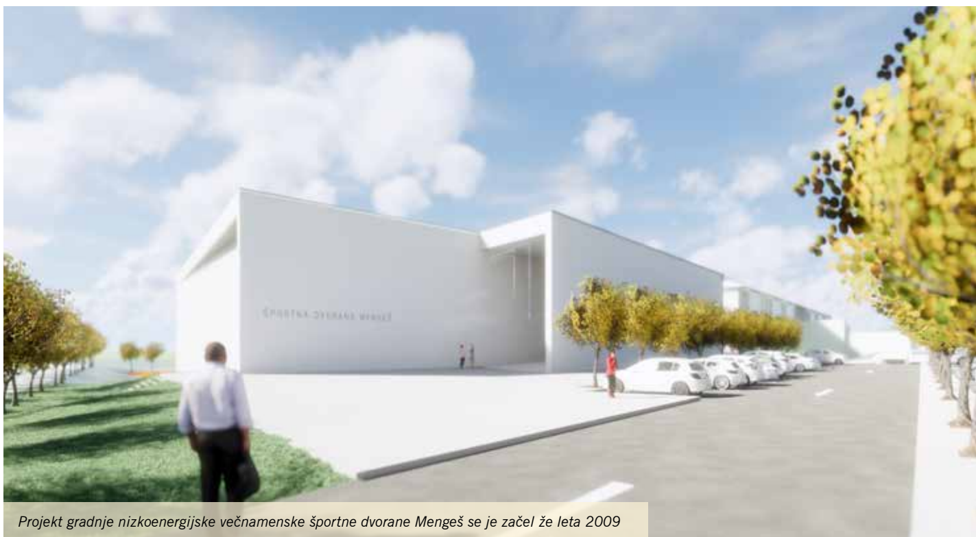
Projekt gradnje nizkoenergijske večnamenske športne dvorane Mengeš se je začel že leta 2009

V letu 2018 bo Občina Mengeš začela drugo fazo reševanja prostorske problematike Osnovne šole Mengeš, zgradila bo športno dvorano. Pripravljajo pa se tudi projekti za dokončno preureditev Osnovne šole Mengeš, in sicer preureditev obstoječe telovadnice v jedilnico in kuhinjo, knjižnico ter manjkajoče kabinete za kakovostnejše delo pedagoških in strokovnih delavcev na šoli.