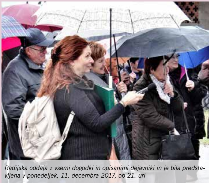
Radijska oddaja z vsemi dogodki in opisanimi dejavniki in je bila predstavljena v ponedeljek, 11. decembra 2017, ob 21. uri