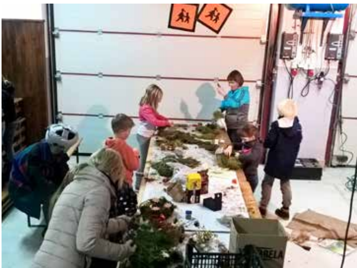
»Želeli smo, da se otroci prepustijo domišljiji in si izdelajo unikatni venček«

December je bogat in dejaven mesec in takšen je bil tudi med mladimi v prostovoljnem gasilskem društvu Topole. V soboto, 2. decembra, smo organizirali delavnico izdelovanja adventnih venčkov. Adventni venček simbolizira čas do božiča, hkrati pa obuja tradicijo in vzpodbuja druženje in pogovor v družini.