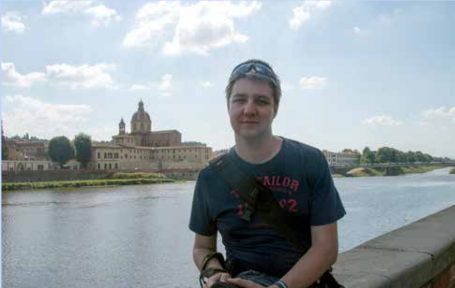
Pri športu se stkejo tudi prijateljstva, saj se s soigralci, s katerimi treniraš, redno videvaš in tako vsi delujejo kot enovita skupina