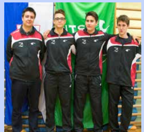
Več uspehov je dosegel v zadnjih letih kot trener, saj njegovi igralci in igralkе dosegajo zelo lepe uspehe na državni in mednarodni ravni

Besedilo: Blanka Tomšič