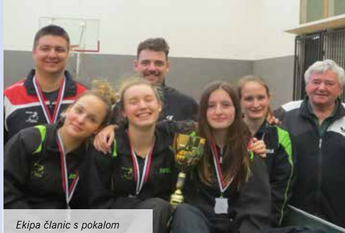
Ekipa članic s pokalom