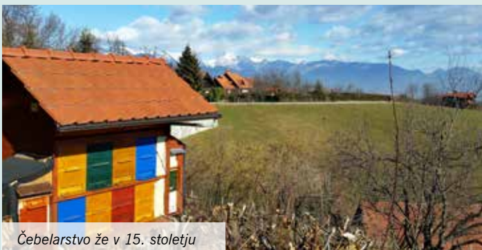
Čebelarstvo že v 15. stoletju