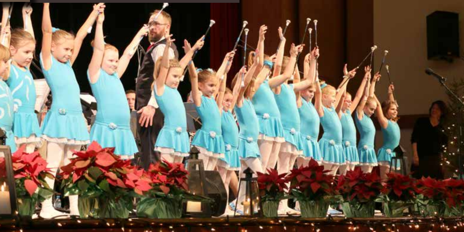
Z godbo so ponovno sodelovale Mengeške mažoretke, ki jih je vedno več