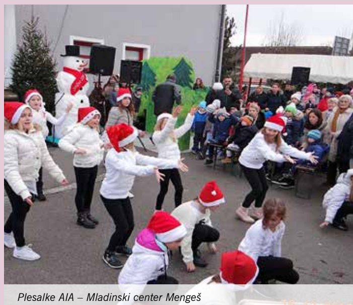
Plesalke AIA – Mladinski center Mengeš