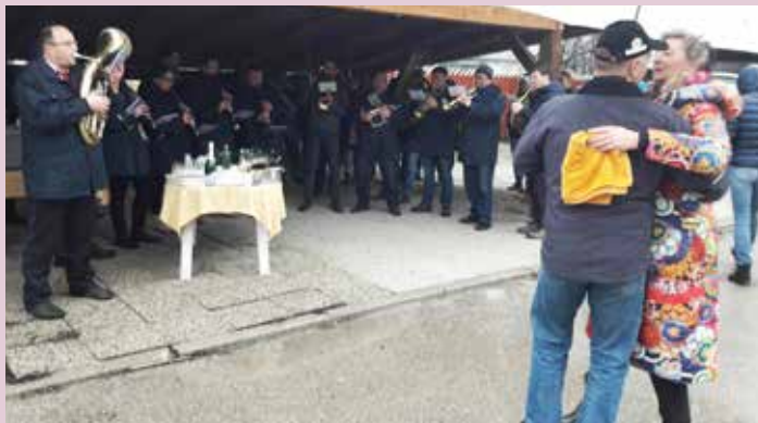
Novoletni pozdrav pri županu Jeriču.

Besedilo: Maja Keržič