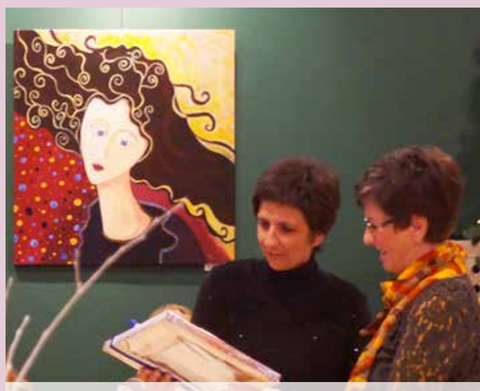
Zahvala Špas teatru ob 20-letnici delovanja za gostoljubnost in sodelovanje

Na stenah je razstavljeno 17 likovnih del velikosti 80 x 80 cm, ki jih