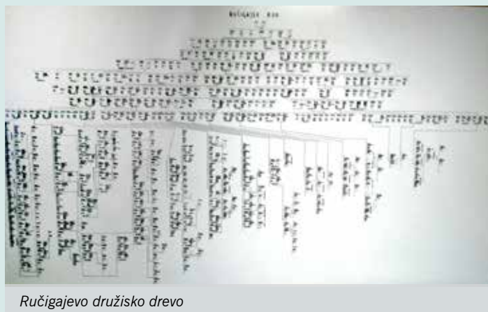
Ručigajevo družisko drevo