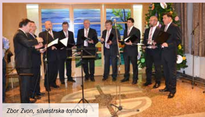
Zbor Zvon, silvestrska tombola