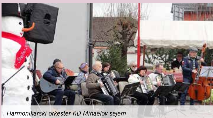
Harmonikarski orkester KD Mihaelov sejem