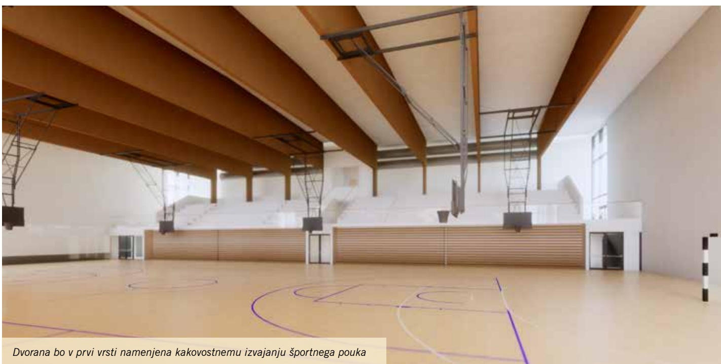
Dvorana bo v prvi vrsti namenjena kakovostnemu izvajanju športnega pouka