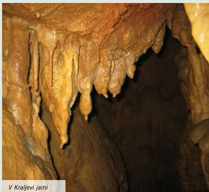
V Kraljevi jami