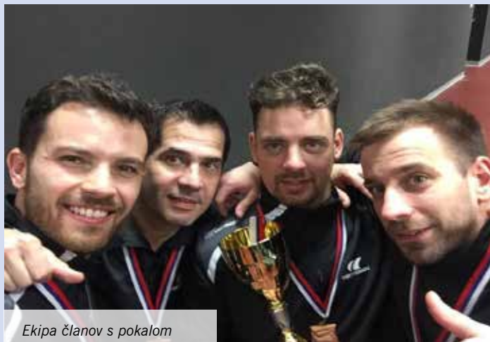
Ekipa članov s pokalom