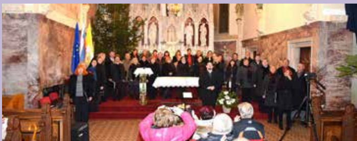
MePZ Svoboda in Večernice v cerkvi sv. Mihaela v Mengšu.