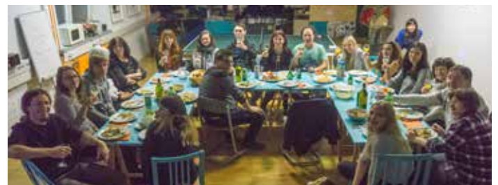
Zaključno srečanje so popestrili z glasbenim programom

Ob zaključku leta smo 23. decembra v AIA – Mladinskem centru Mengeš organizirali zaključno srečanje naših prostovoljcev.