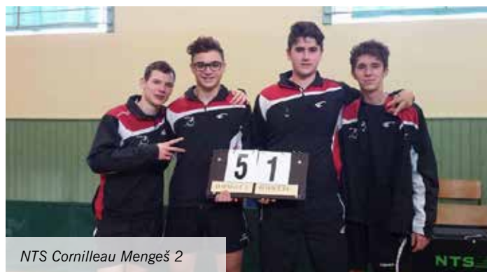
NTS Cornilleau Mengeš 2